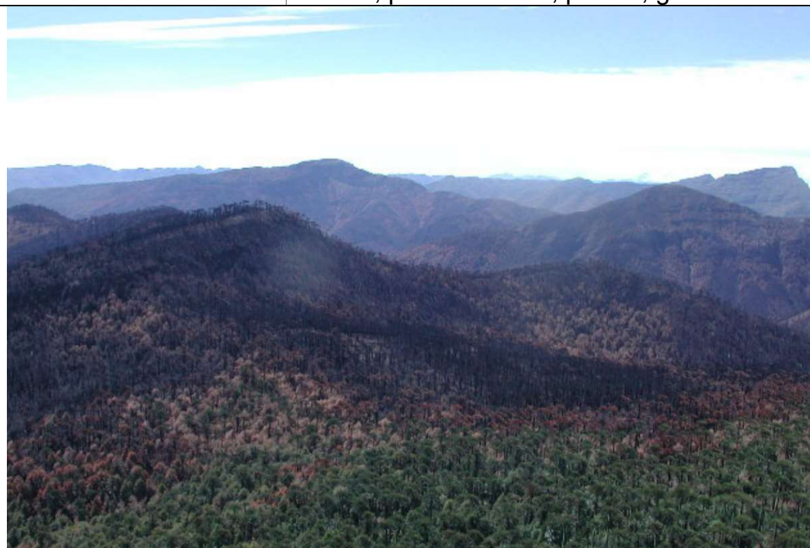
Figura 1. Efecto de incendios en bosques de Araucaria araucana en la Región de la Araucanía, año 2002