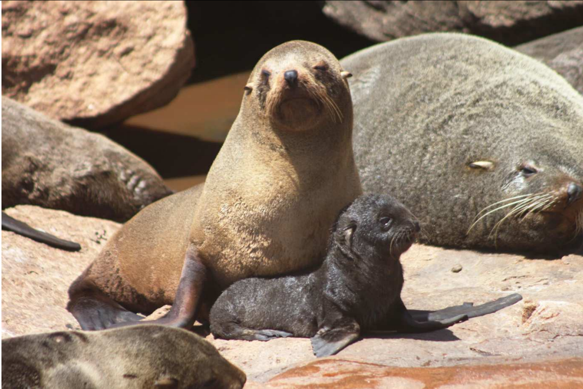
Fotografía del Arctocephalus australis (Autora: Josefina Gutiérrez)