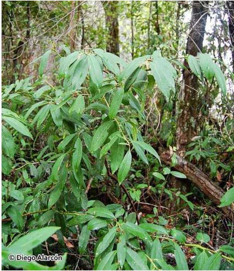
Figura 1: Hábito del arbusto Gaultheria renjifoana Phil. , creciendo en el sotobosque de un renoval nativo en las cercanías de Laraquete, Región del Biobío