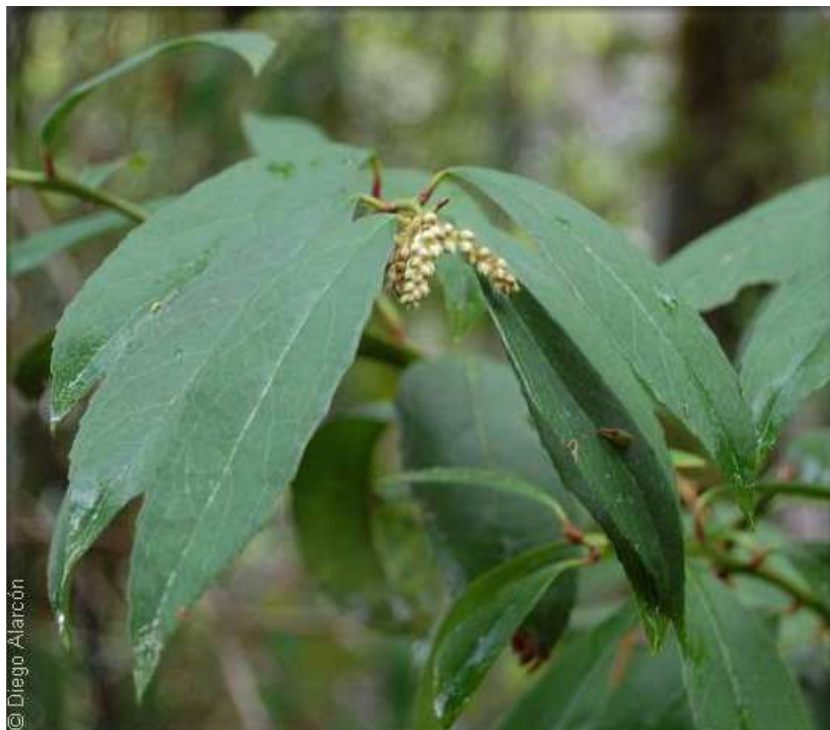
Figura 2: Rama del arbusto Gaultheria renjifoana Phil. , con la disposición de sus hojas y espiga floral terminal. Alrededores de Laraquete, Región del Biobío.