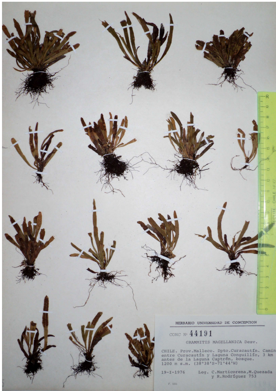
Grammitis magellanica