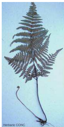
Hypolepis poeppigii