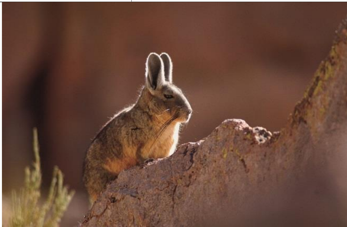
Fotografía del Lagidium viscacia (Claudio Almarza)