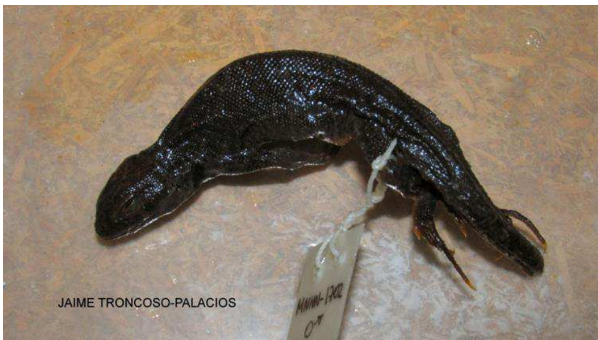
Lagartija de Fitzinger