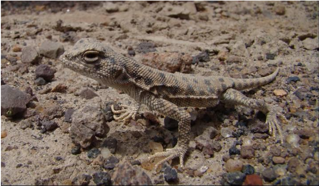
Liolaemus poconchilensis (autor Charif Tala G.)