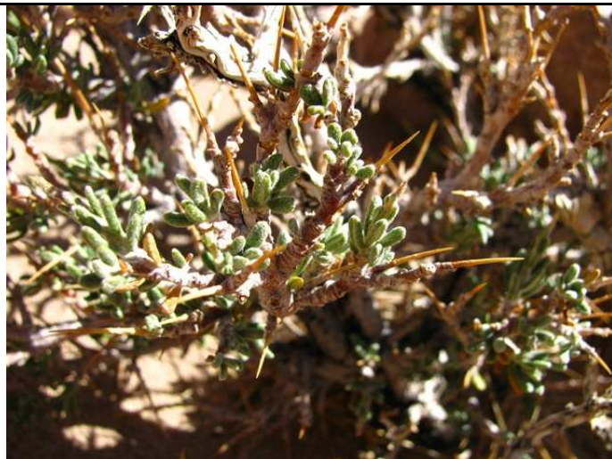
Ocyroe armata (detalle)