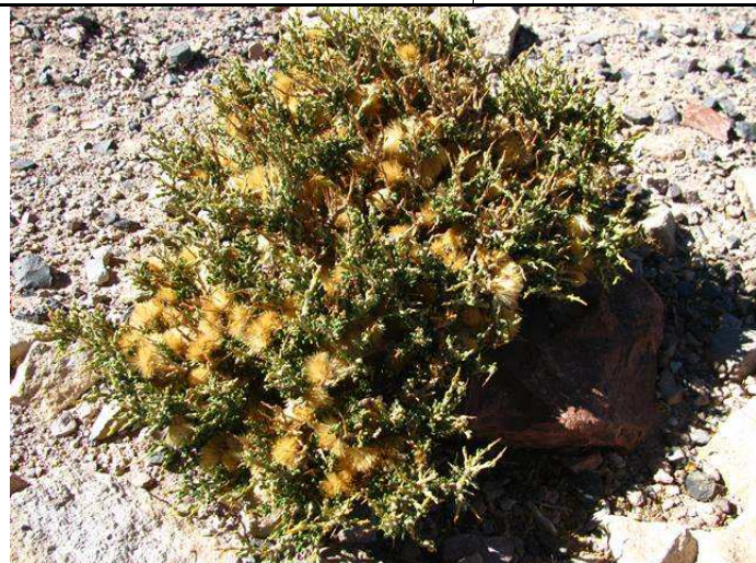
Ocyroe armata (Hábito)