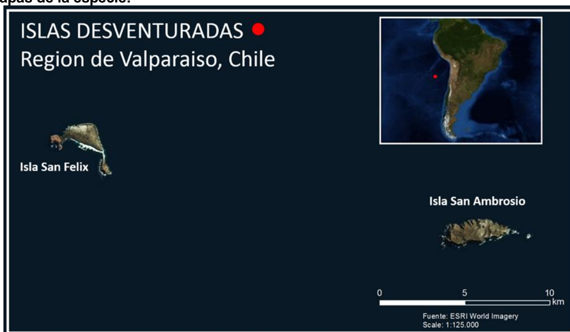
Distribución de Parietaria feliciana