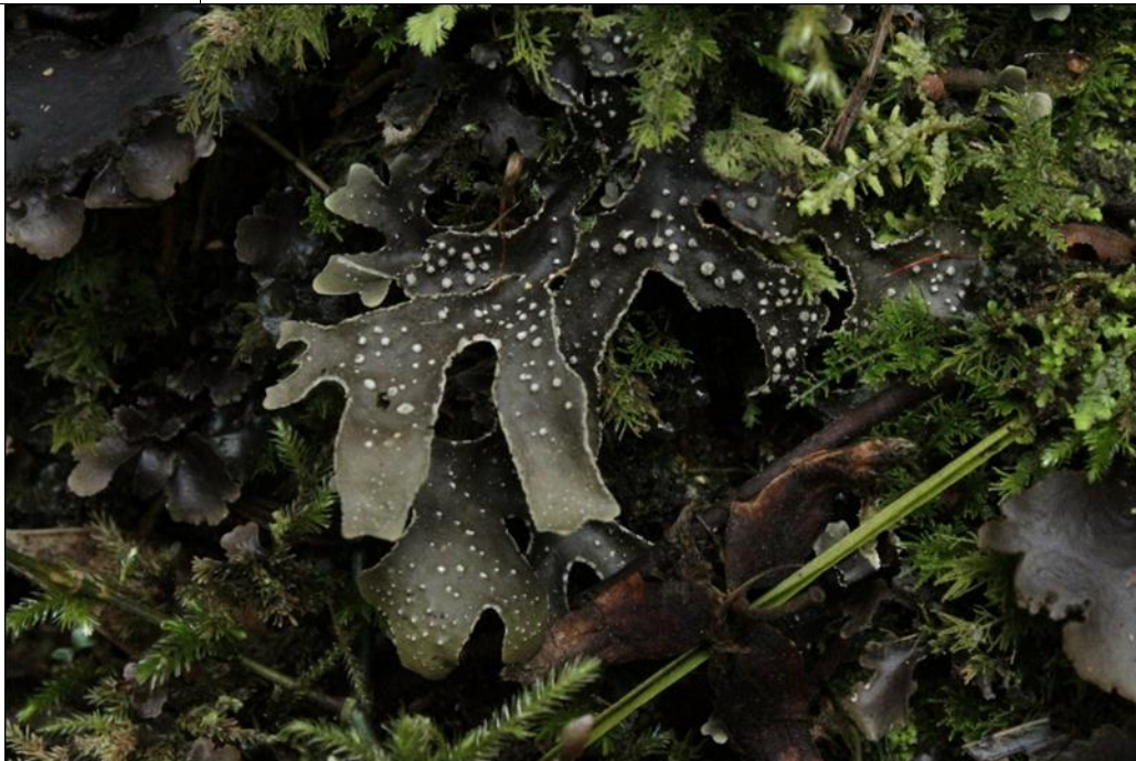
Figura: Pseudocyphellaria intricata en Parque Ecológico y Cultural Rucamanque.