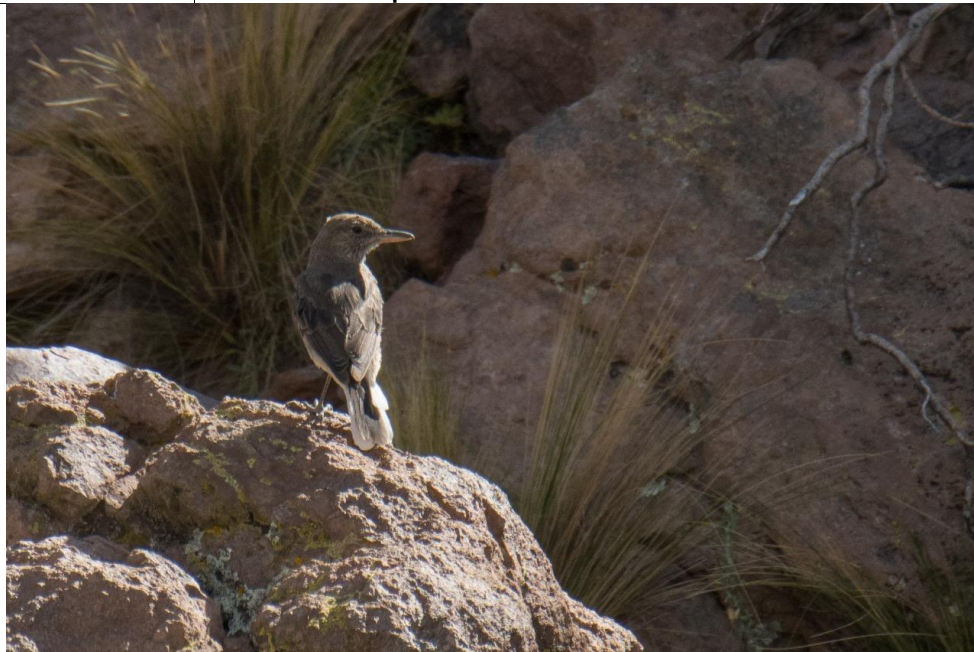
Fotografía del mero de la puna.