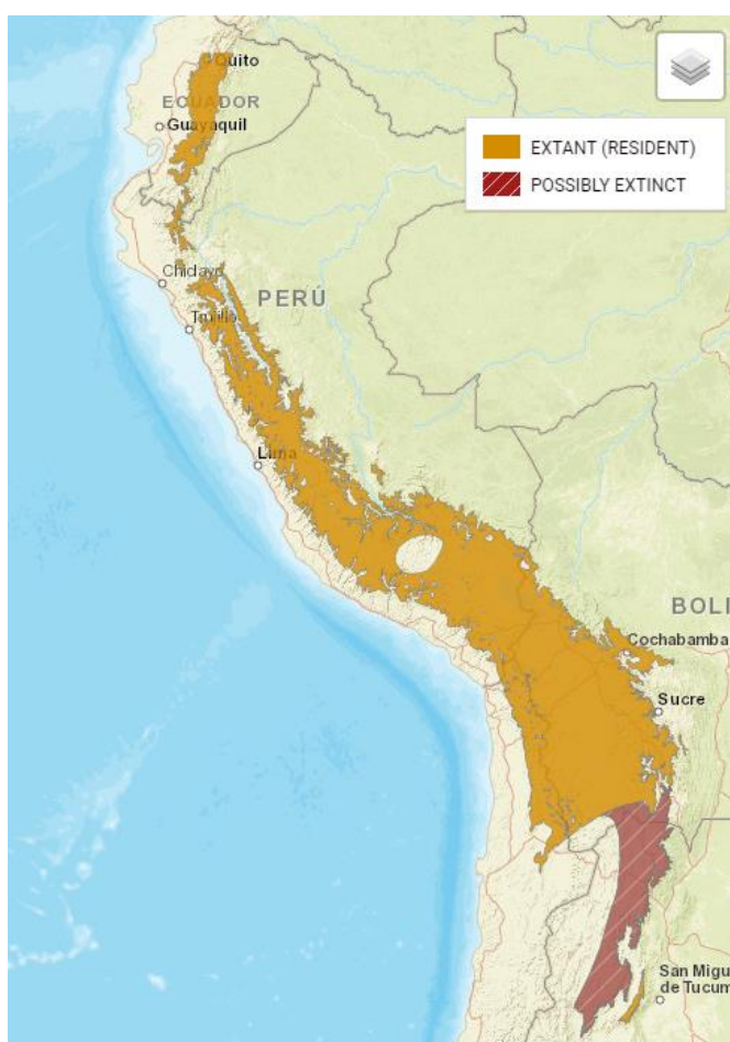
Distribución aproximada de Agriornis albicauda tomada desde UICN ( https://www.iucnredlist.org/species/22700081/93760752 )