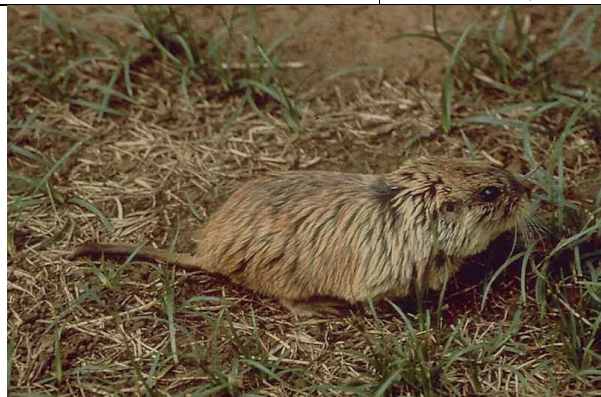
Fotografía de Ctenomys fulvus (G. Hickmann en: Muñoz-Pedrerros & Yáñez 2000)