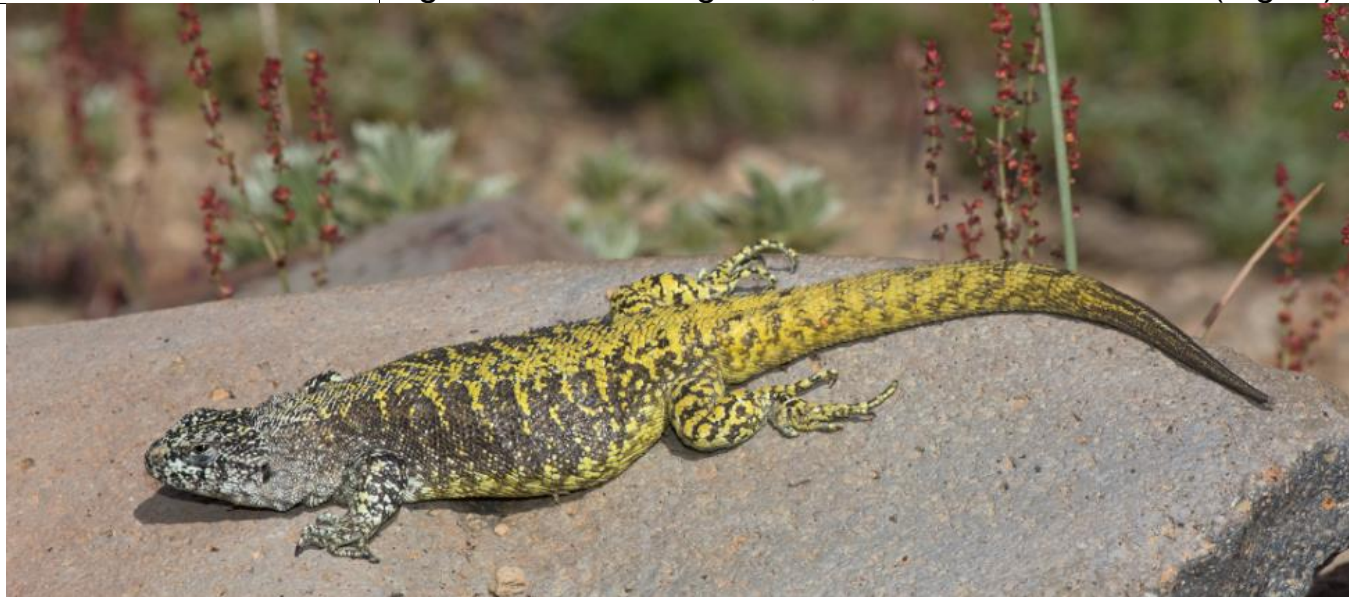
Fotografía Liolaemus flavipiceus