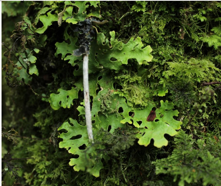
Figura: Pseudocyphellaria nitida