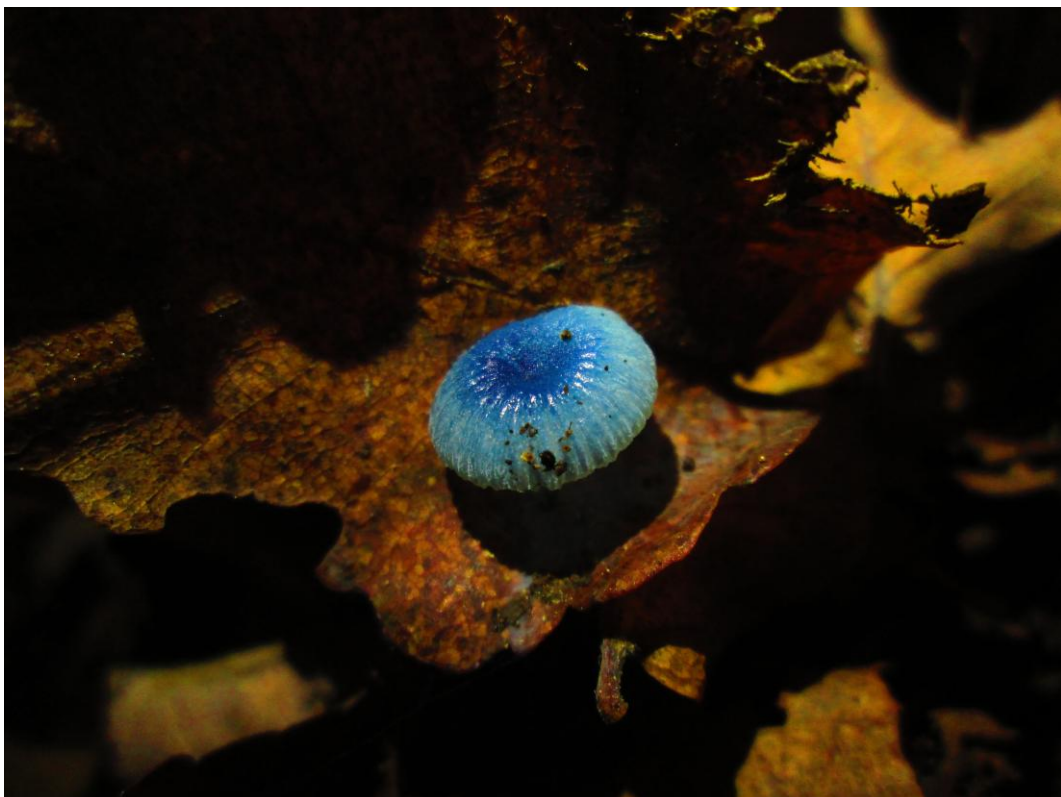
Figura 2. Mycena cyanocephala Singer Fructificando sobre hoja de Nothofagus glauca