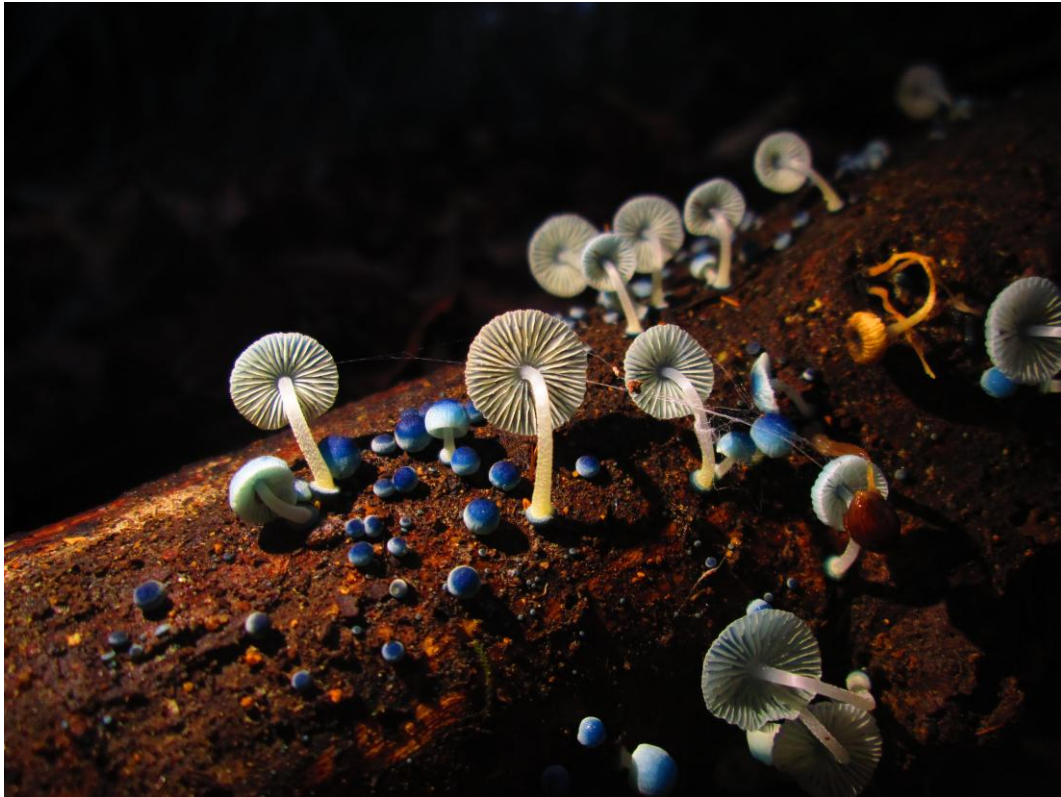
Figura 1. Mycena cyanocephala Singer