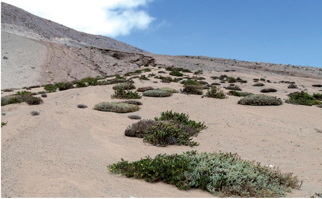
Fig. 4. Hábitat de Ectinogonia barrigai Moore 2017 (Coleoptera: Buprestidae), en Monumento Natural Paposo Norte, Región de Antofagasta, Chile. (Tomado de Moore 2017).