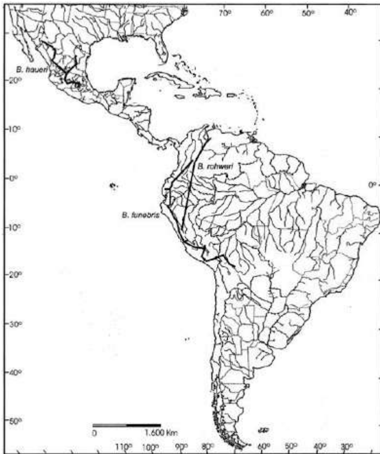
Figure 6 Individual tracks of species of Bombus ( Br. ) haueri Handlirsch, B. (Fr.) rohwani Frison and B. (Fr.) funebris Smith.