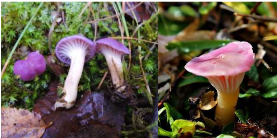
Figura 1: Basidiomas de Cuphophyllus adonis : con píleo liláceo y con píleo rosado.