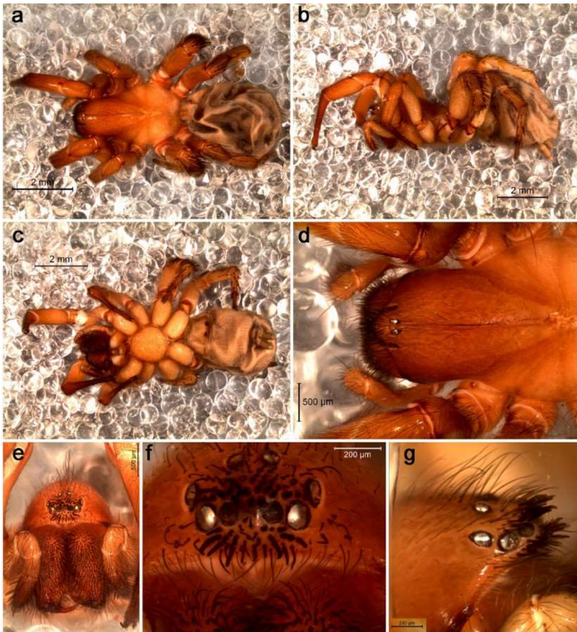
Fig. 1. Cyrioctea islachanaral Grismado & Pizarro-Araya 2016 (Araneae: Zodariidae), Holotipo hembra, a) Habitus vista dorsal, b) Habitus, vista lateral, c) Habitus, vista ventral, d) Área cefálica del prosoma, vista dorsal, e) Área cefálica del prosoma, vista anterior, f) Detalle del área ocular, vista anterior, g) Detalle del área ocular, vista lateral.