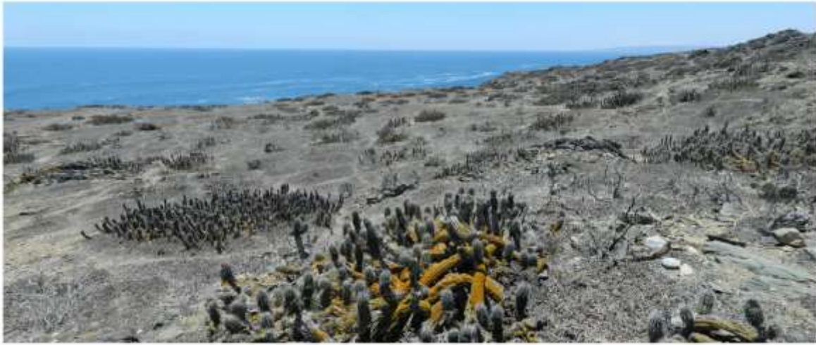
Fig. 4. Hábitat de Cyrioctea islachanaral Grismado & Pizarro-Araya 2016 (Araneae: Zodariidae), en la parte norte de la Isla Chañaral, Reserva Nacional Pingüino de Humboldt, Región de Atacama, Chile.