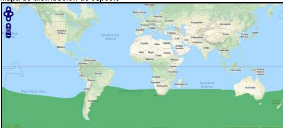
Figura 3. Rango de distribución de D. exulans (verde = residente nativo).