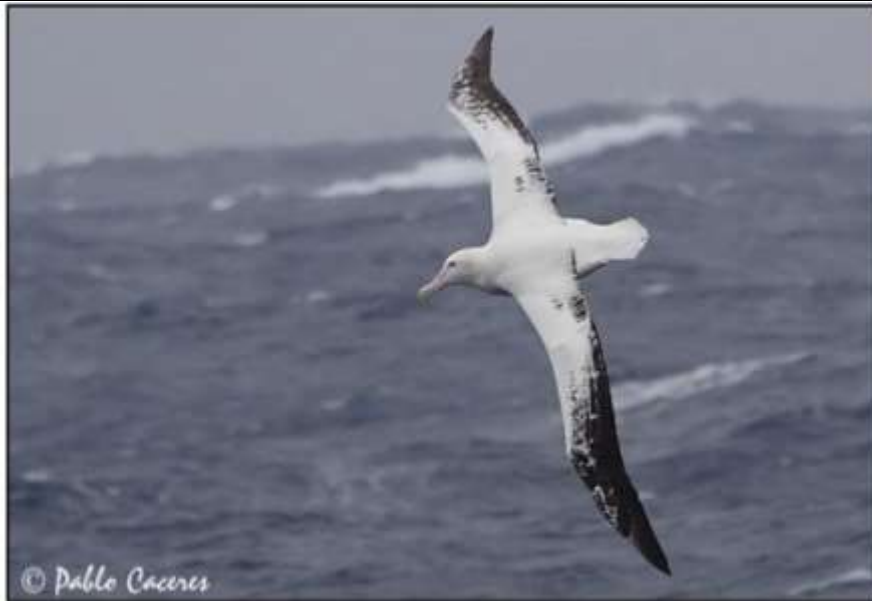
Figura 1: Fotografía de Diomedea exulans (adulto).