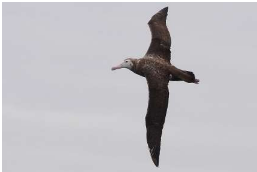
Figura 2: Fotografía de Diomedea exulans (juvenil). (Crédito: © Pablo Cáceres).