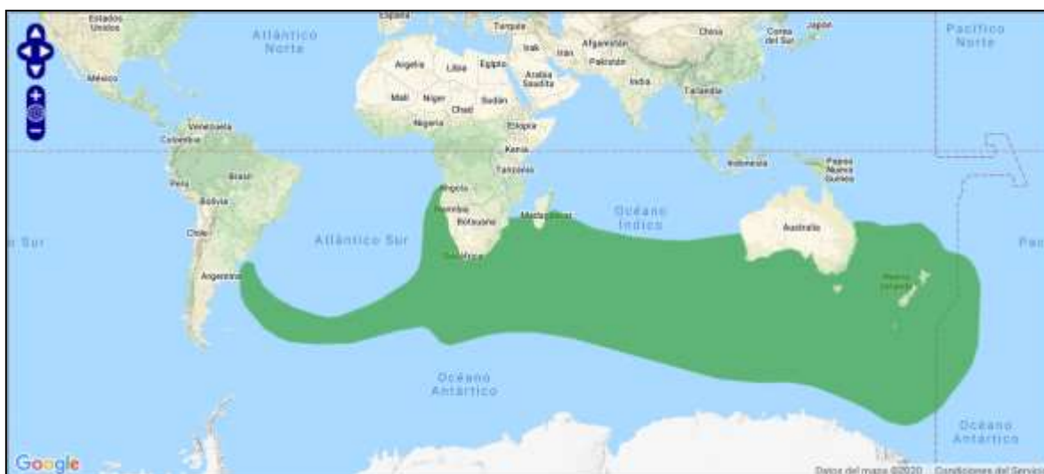
Figura 2. Rango de distribución de T. c. cauta (verde = residente nativo).