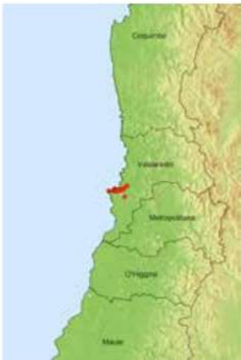
Diagrama de distribución de A. marticorenae . Extraído de Guía de Campo Alstroemerias Chilenas (Finot et al. 2018)