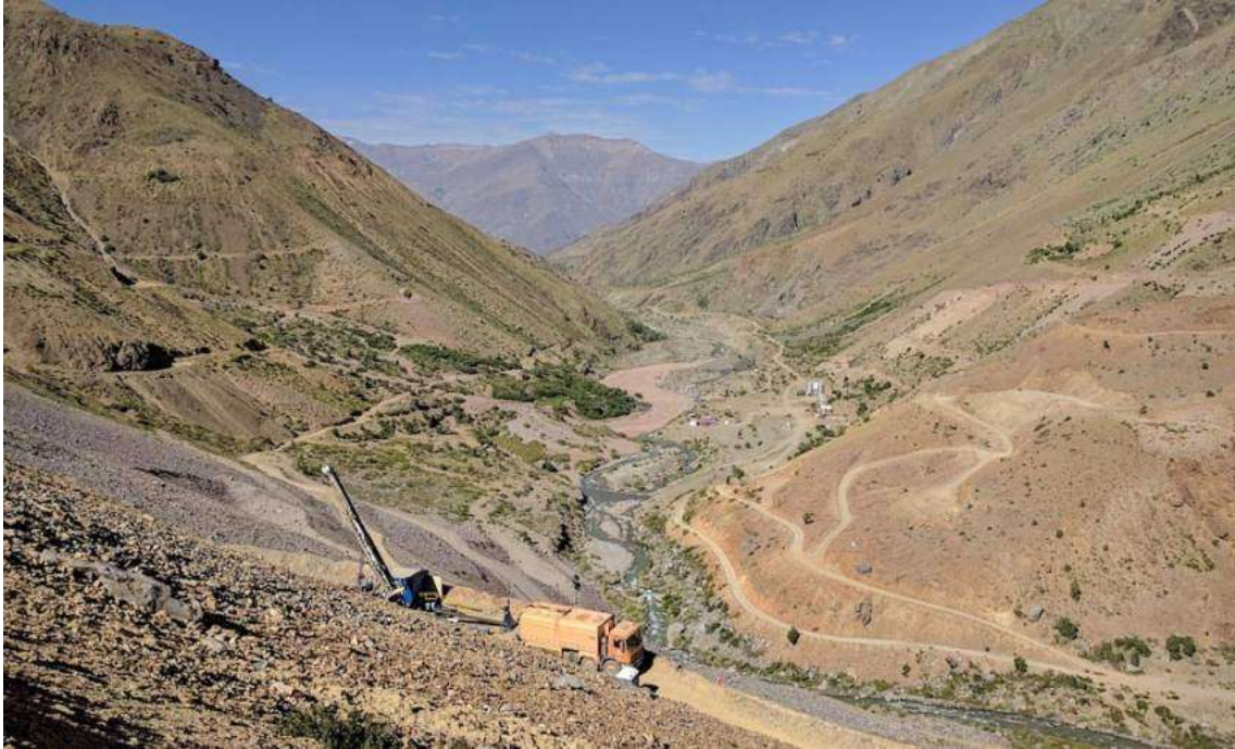
Foto 2. Destrucción de hábitat de A. spathulata por proyecto minero en el río Rocín (Putendo, Provincia de San Felipe). Véase Novoa, 2016.