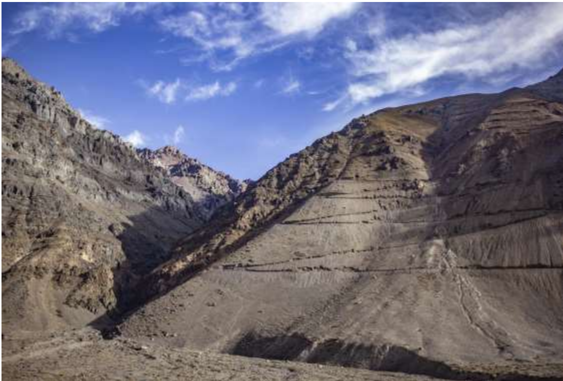
Foto 3. Destrucción de hábitat de A. spathulata por proyecto minero en ladera occidental del río Juncal (Valle Juncal, Provincia de Los Andes).