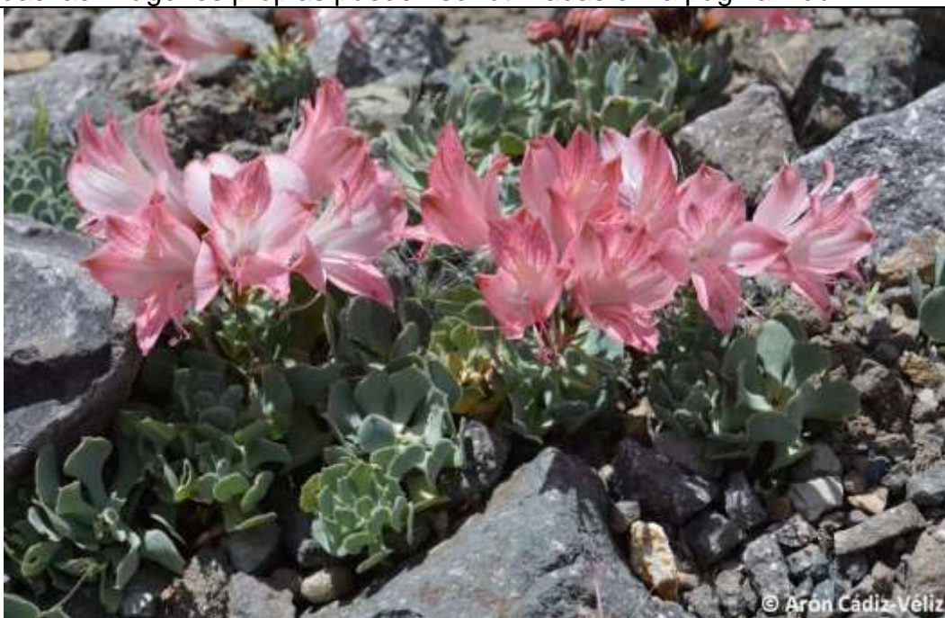
Foto 1a. Individuos maduros de Alstroemeria spathulata (Valle Juncal, Los Andes).

Todas las imágenes propias pueden ser utilizadas en la página web.