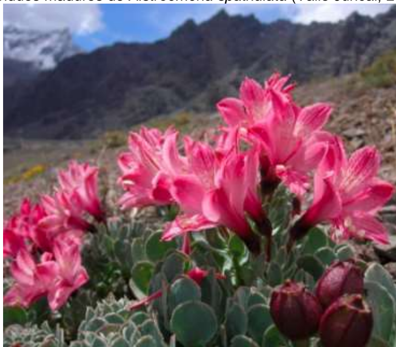
Foto 1b. Individuos maduros de Alstroemeria spathulata (Valle Juncal, Los Andes).