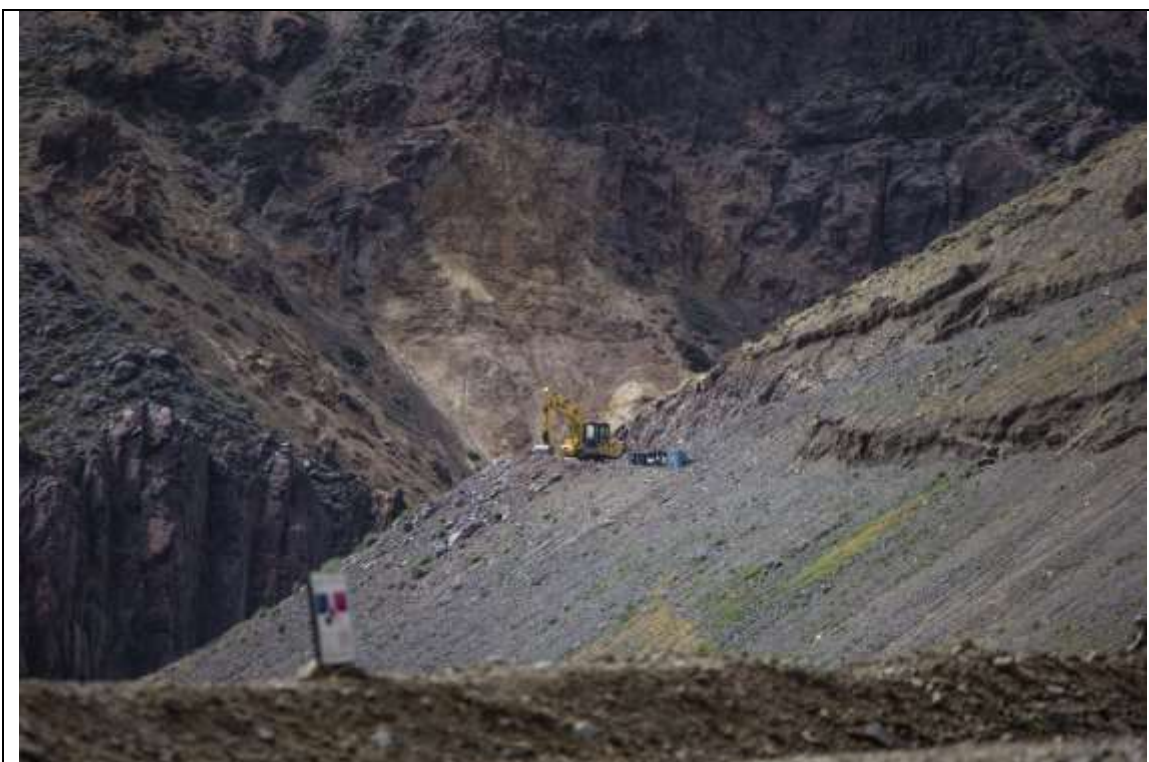
Foto 4. Destrucción de hábitat de Alstroemeria spathulata por proyecto minero en ladera poniente del río Juncal (Valle Juncal, Provincia de Los Andes).