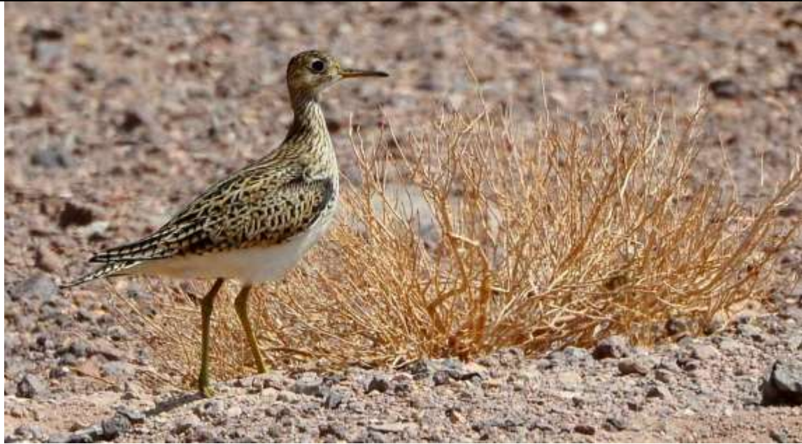
Batitú ( Bartramia longicauda ).