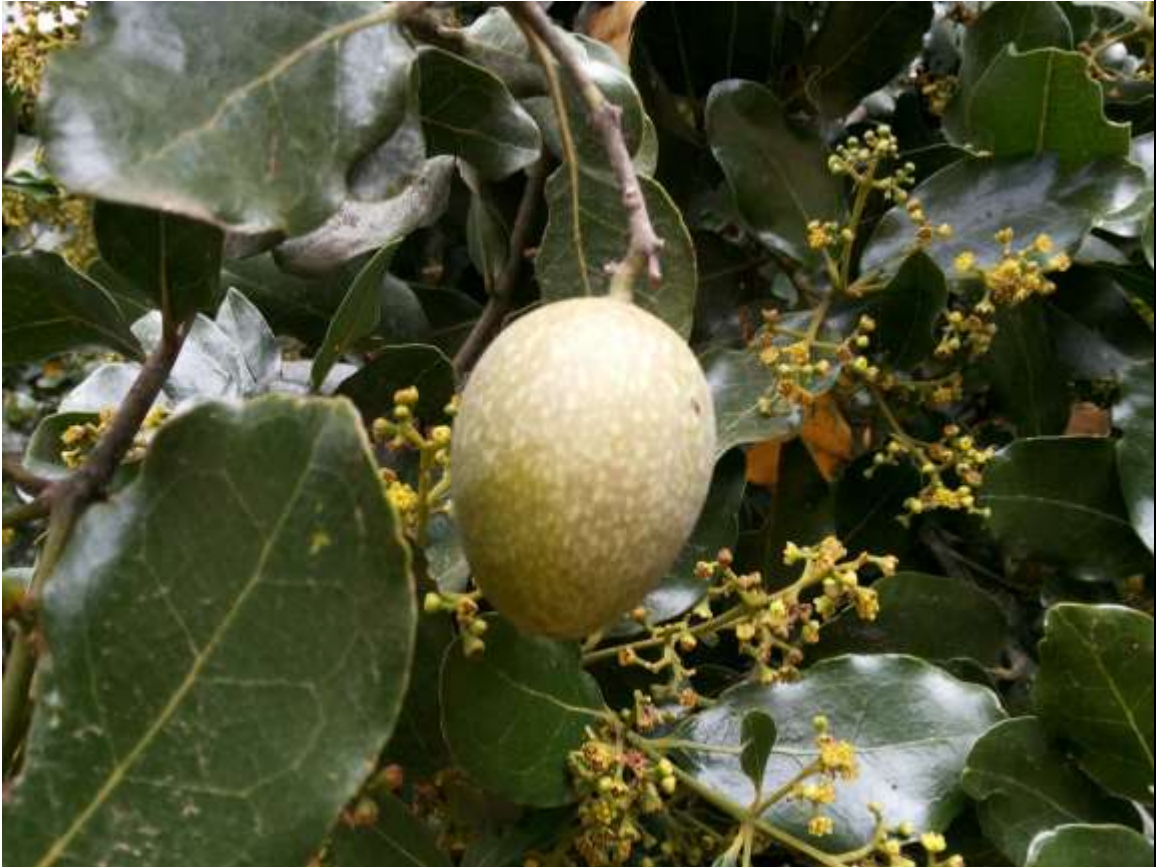
Foto 2. Fruto o "bellota" en etapa terminal de crecimiento.