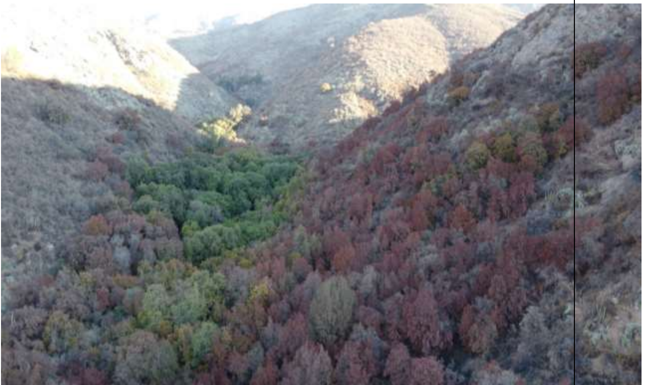
Foto 3. Sector "Bellotal" (Ocoa-Hijuelas) afectado por sequía. Julio, 2020.