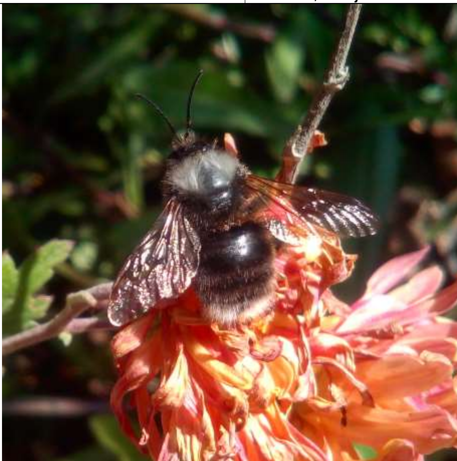
Figura 1. Macho de Bombus funebris Smith, 1854, Tignamar 2019.