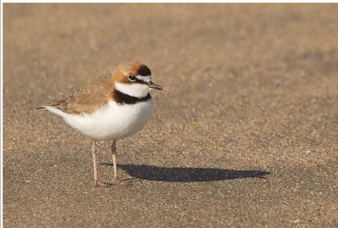
Chorlo de collar ( Charadrius collaris ).