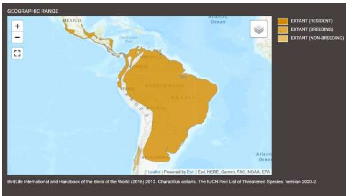
Distribución aproximada de Charadrius collaris (BirdLife International, 2016) https://www.iucnredlist.org/es/species/22693842/93426524