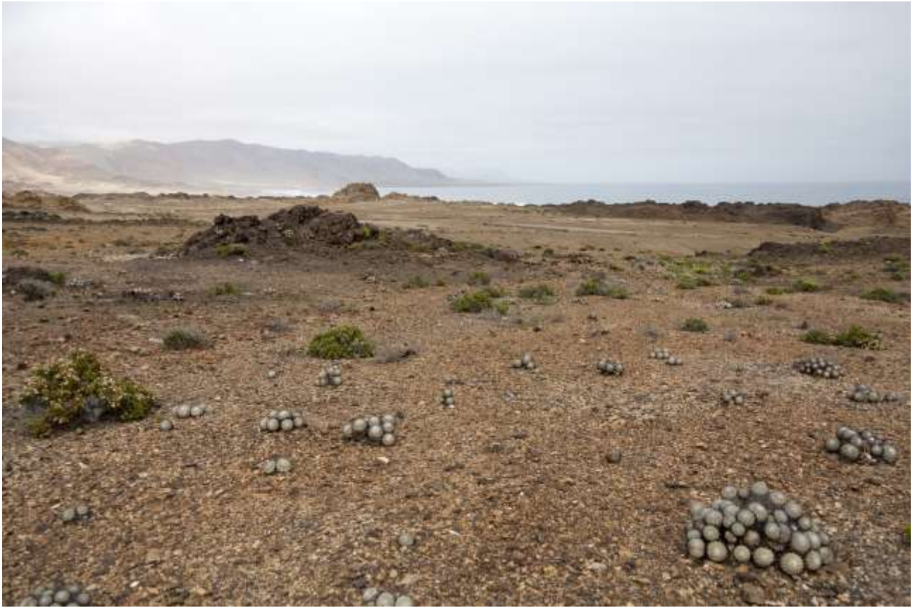
Fig. 3. Hábitat de Ectinogonia chalyboeiventris Germain & Kerremans, 1906 (Coleoptera: Buprestidae) en el Parque Nacional Pan de Azúcar, Limite costero entre las Regiones de Antofagasta y Atacama Chile.