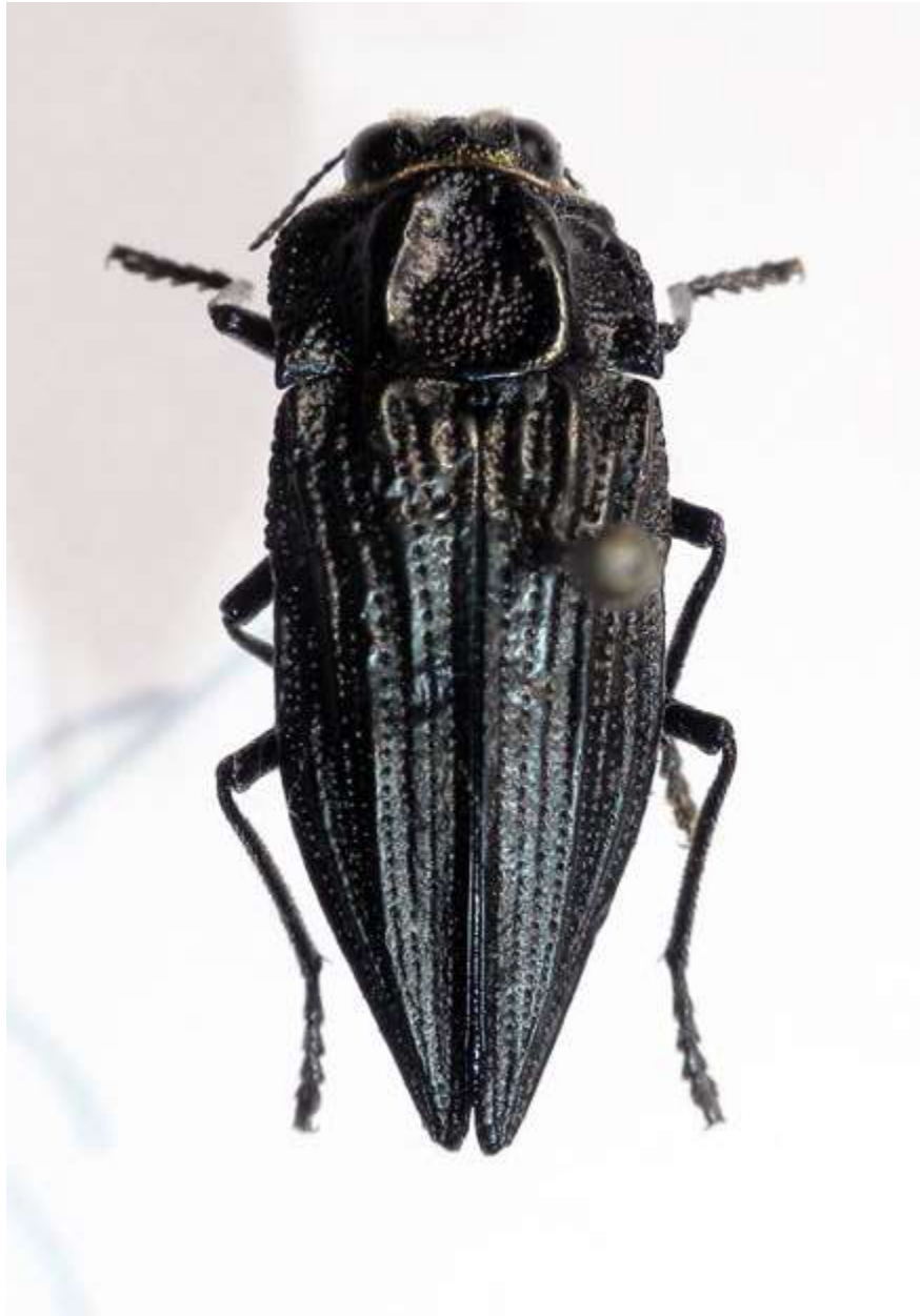
Fig. 1. Vista dorsal de Ectinogonia chalyboeiventris Germain & Kerremans, 1906 (Coleoptera: Buprestidae).