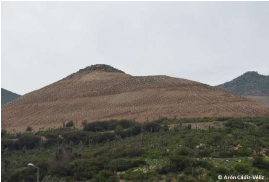
Foto 1. Matorral xerófito, hábitat de Eriosyce coimasensis entre Panquehue y Llay-Llay, reemplazado para el cultivo de paltos (2018).