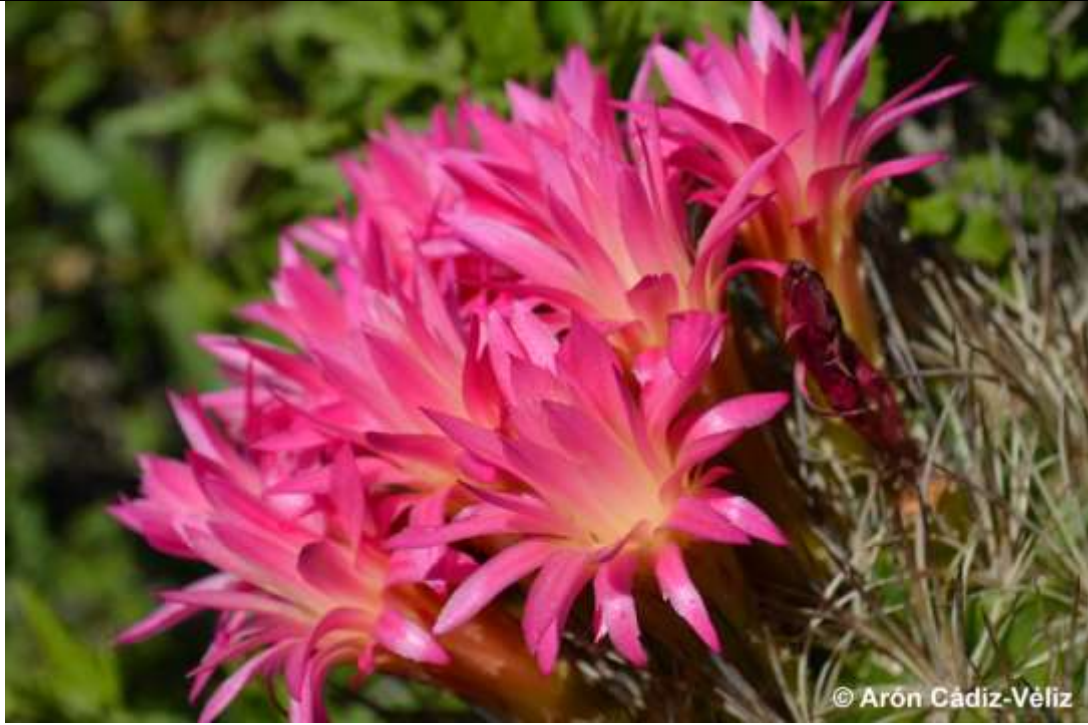
Foto 3. Floración de Eriogyne coimasensis .