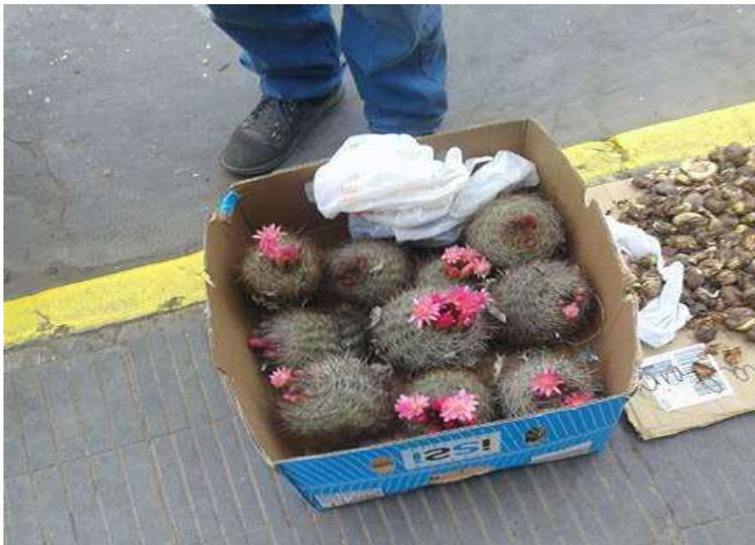
Foto 2. Comercio de individuos reproductivos durante la época de floración en el centro de la ciudad de San Felipe. Son vendidos "a granel" sin sustrato y con raíces expuestas por un valor de $2.000 (CLP) cada uno (agosto, 2017).