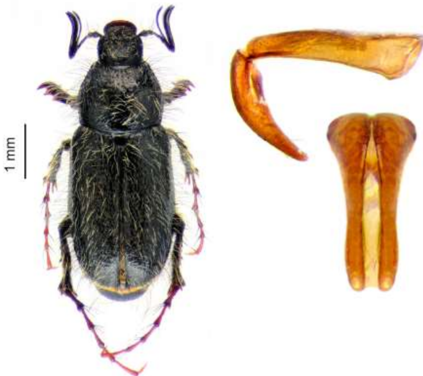
Fig. 1. Luispenaia paposo Mondaca, Pizarro-Araya & Alfaro, 2019 (Coleoptera: Scarabaeidae). A) vista dorsal de un macho; B) detalle de la genitalia del macho (edeago). Modificado de Mondaca et al. (2019).

Fig. 3. Hábitat de Luispenaia paposo Mondaca, Pizarro-Araya & Alfaro, 2019 (Coleoptera: Scarabaeidae).