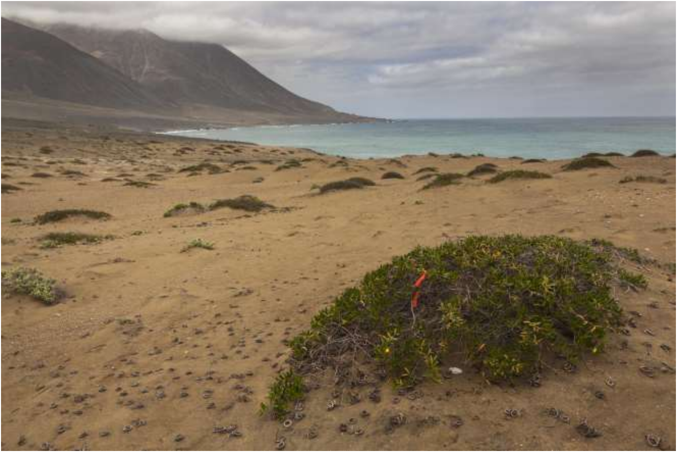
Fig. 3. Hábitat de Luispenaia paposo Mondaca, Pizarro-Araya & Alfaro, 2019 (Coleoptera: Scarabaeidae).