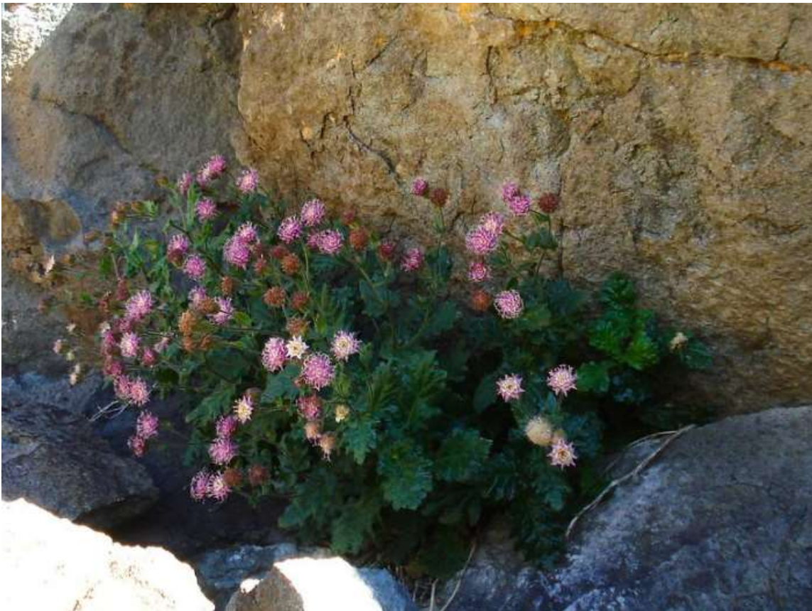
Figura 5. Ejemplares de Marticorenia foliosa creciendo a la sombra en orientación sur-este. Parque Andino Juncal.