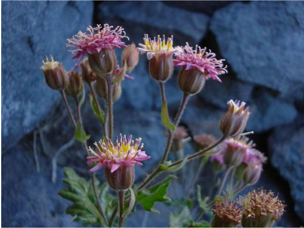
Figura 4. Marticorenia foliosa , Parque Andino Juncal.