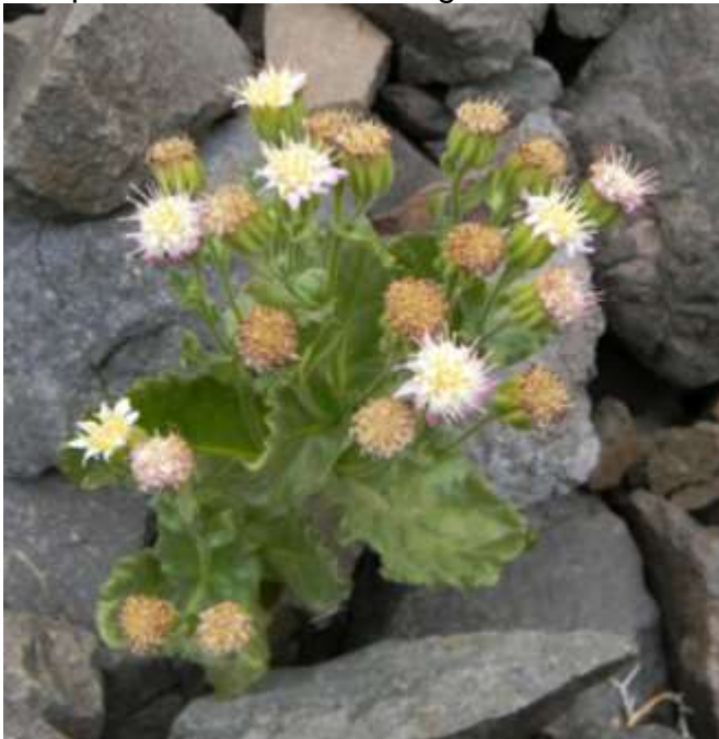
Figura 1. Hábito de Marticorenia foliosa . Individuo creciendo entre las rocas, Parque Andino Juncal.