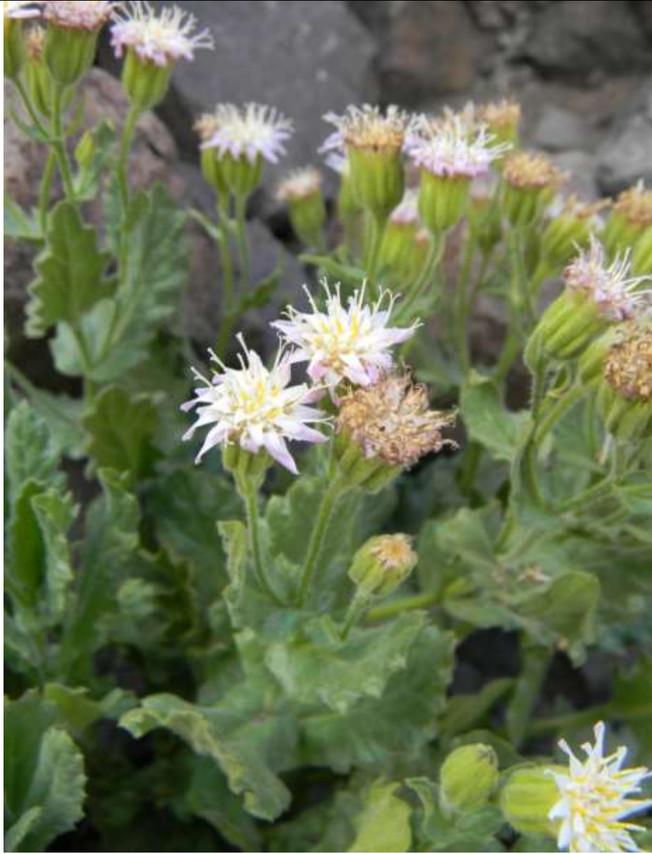
Figura 2. Hábito de Marticorenia foliosa . Individuo creciendo entre las rocas, Parque Andino Juncal.