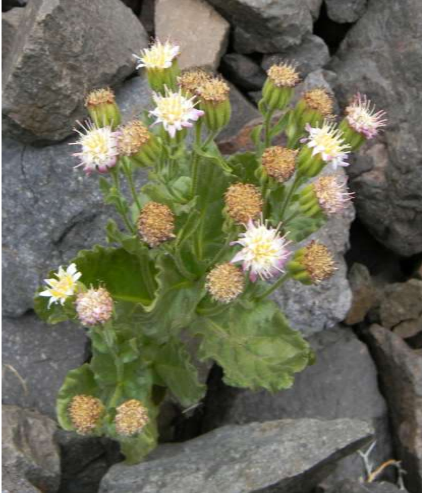
Figura 1. Hábito de Marticorenia foliosa . Individuo creciendo entre las rocas, Parque Andino Juncal.

Todas las imágenes adjuntas en esta ficha pueden ser utilizadas en la página web del MMA.