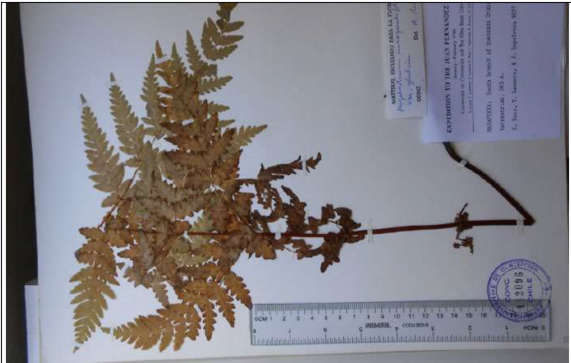
Herbario CONC, fotografía proveniente de Penneckamp (2018).