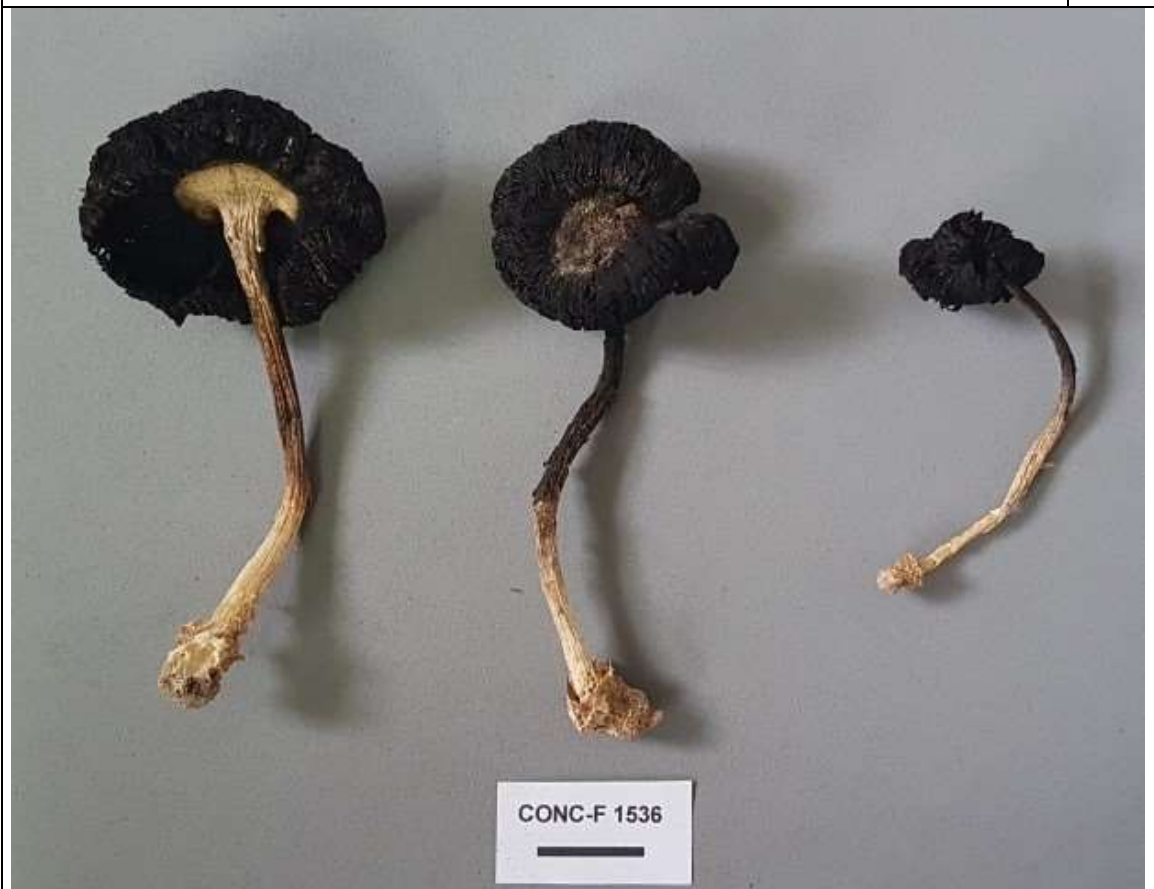
Figura 1. Basidiomas de Montagnea arenaria (DC.) Zeller.