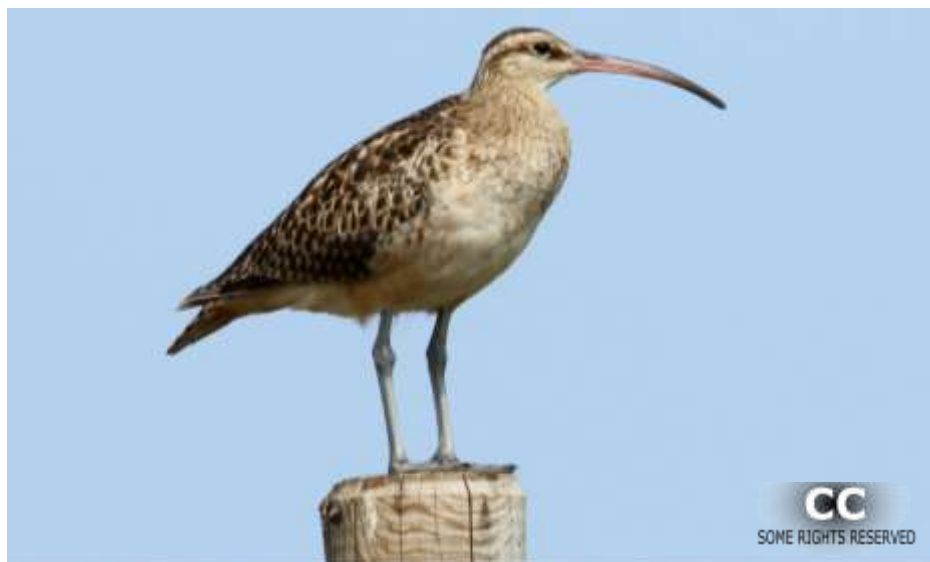
Fotografía de Numenius tahitiensis