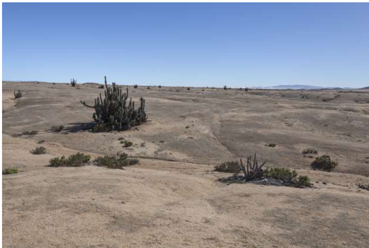
Fig. 3. Hábitat de Nycterinus ( Paranycterinus ) angusticollis Philippi & Philippi, 1864 (Coleoptera: Tenebrionidae) en Parque Nacional Pan de Azúcar, sector Las Lomitas (Regiones de Antofagasta y Atacama, Chile).