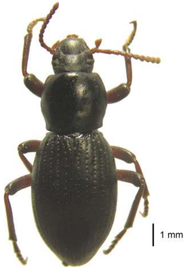
Fig. 1. Vista dorsal de un macho de Nycterinus ( Paranycterinus ) angusticollis Philippi & Philippi, 1864 (Coleoptera: Tenebrionidae).