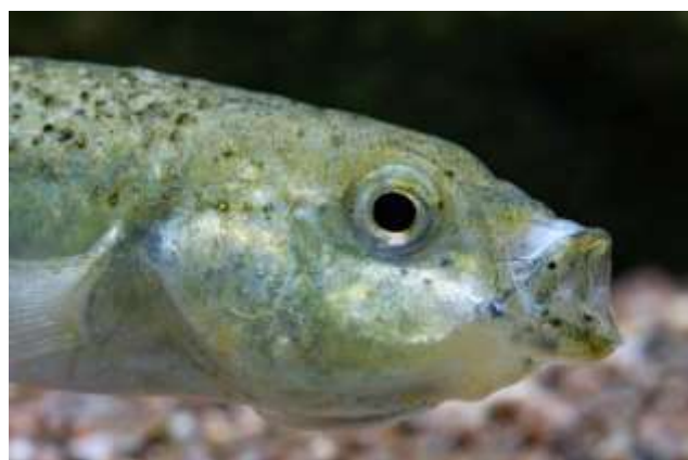
Figura 2. Orestias gloriae