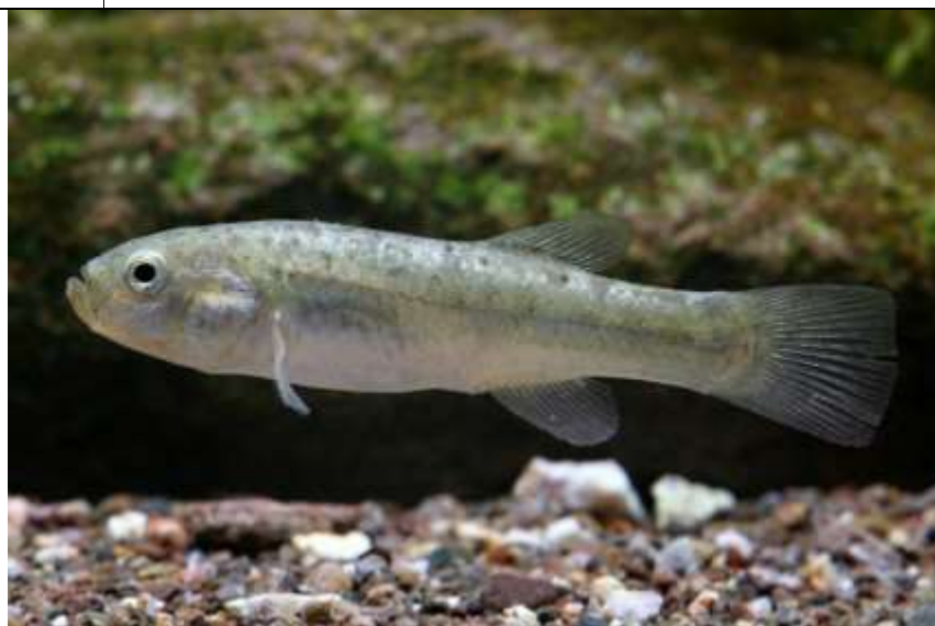
Figura 1. Orestias gloriae