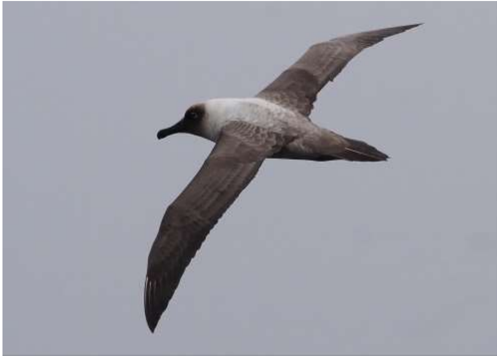
Figura 2. Fotografía de Phoebastria palpebrata (juvenil, vista dorsal).