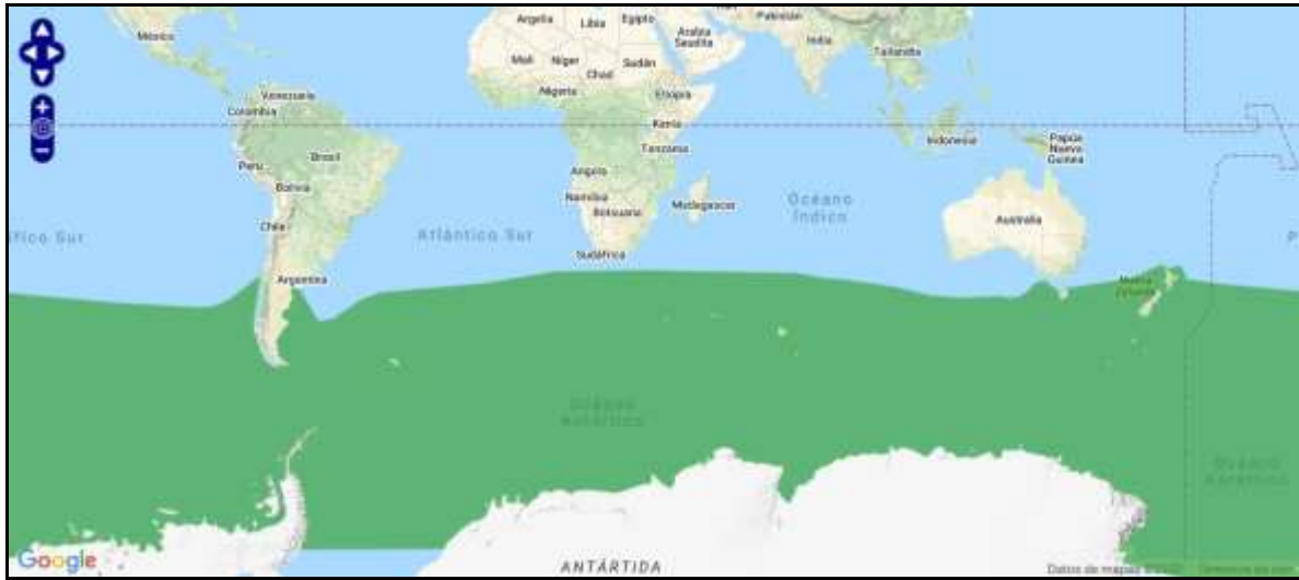
Figura 3. Rango de distribución de P. palpebrata (verde = residente nativo).