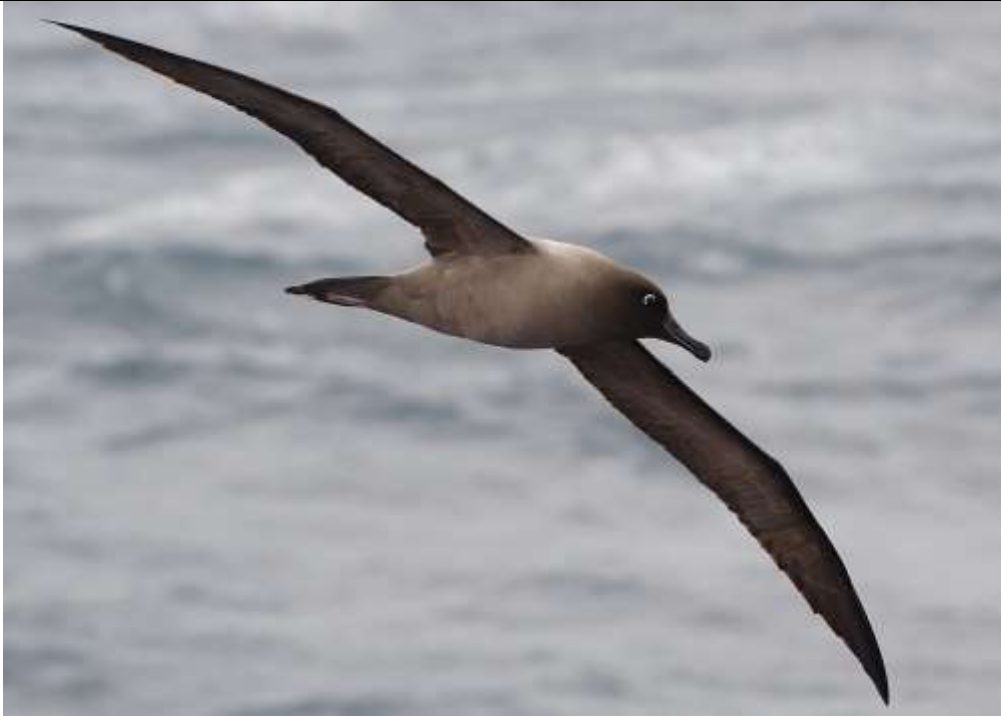
Figura 1. Fotografía de Phoebastria palpebrata (vista ventral).