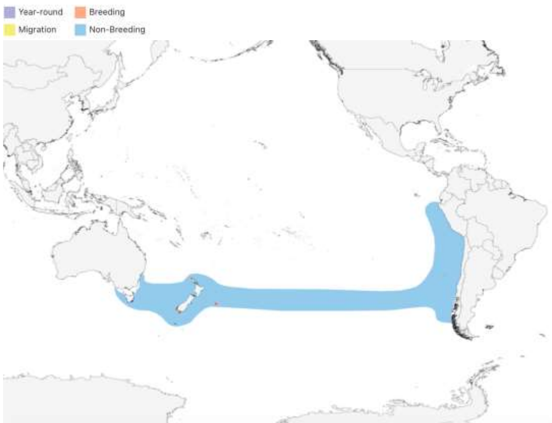
Distribución de Thalassarche bulleri (Carboneras et al., 2020) https://birdsoftheworld.org/bow/species/bulalb2/cur/introduction#distrib