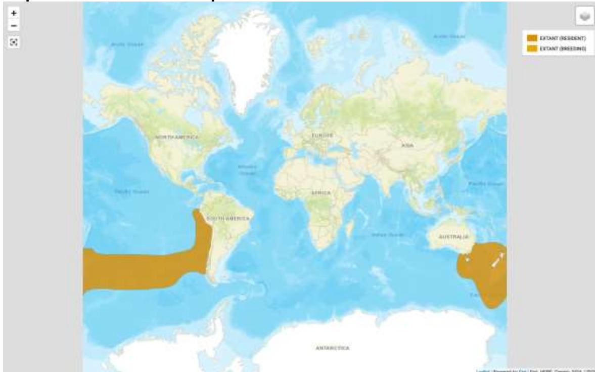
BirdLife International and Handbook of the Birds of the World (2016) 2013. Thalassarche bulleri . The IUCN Red List of Threatened Species. Version 2020-2.