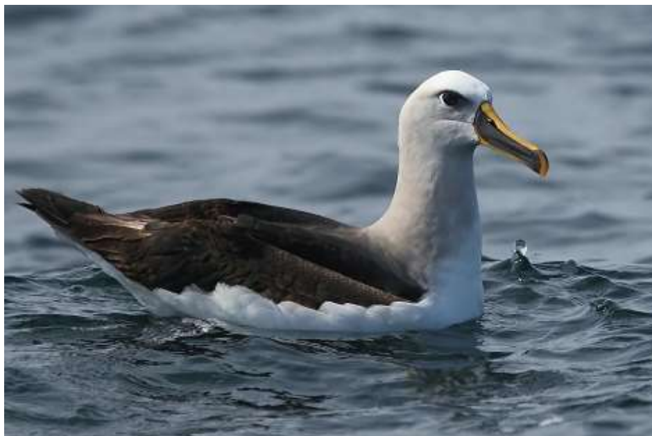
Albatros de Buller ( Thalassarche bulleri ). Fotografía: Pablo Cáceres