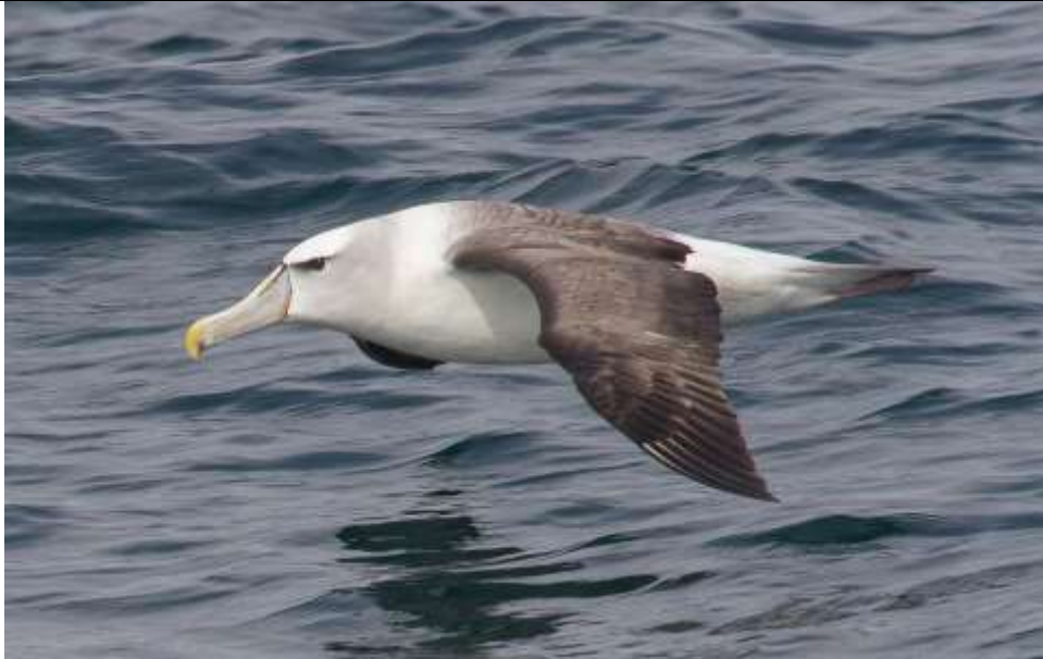
Figura 1. Fotografía de Thalassarche cauta (adulto). Avistamiento en aguas frente a Valparaíso, noviembre de 2016.

Mapas de distribución, ver en página siguiente.