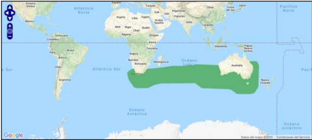
Figura 3. Rango de distribución de T. c. steadi (verde = residente nativo).