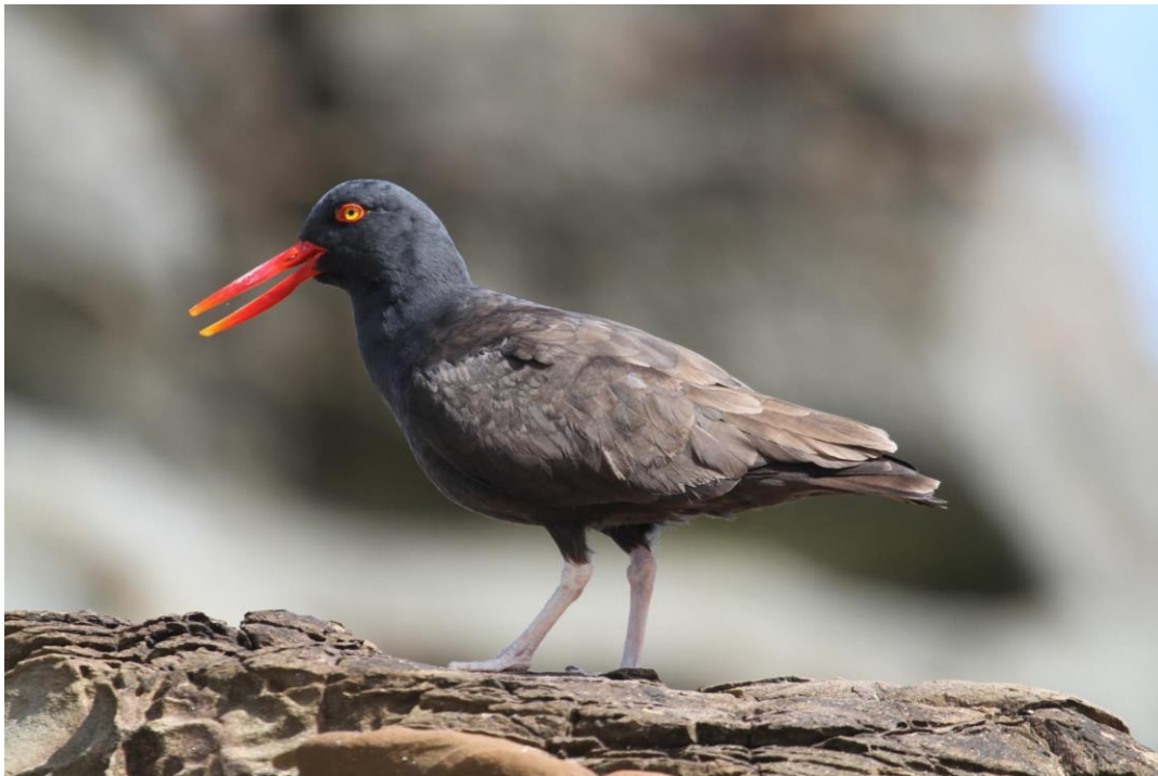
Pilpilén negro ( Haematopus ater ). Autor: Ivo Tejeda