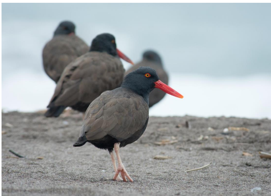
Pilpilén negro ( Haematopus ater ). Autor: Cristian Pinto