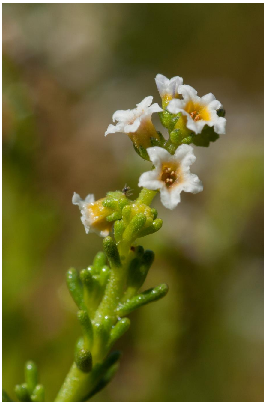
Se permite el uso de la fotografía para su utilización