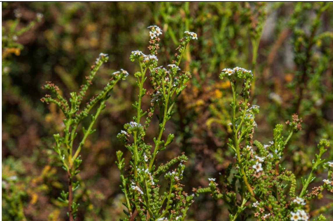
Autoría: Sergio Ibáñez. Se permite el uso de la fotografía para su utilización