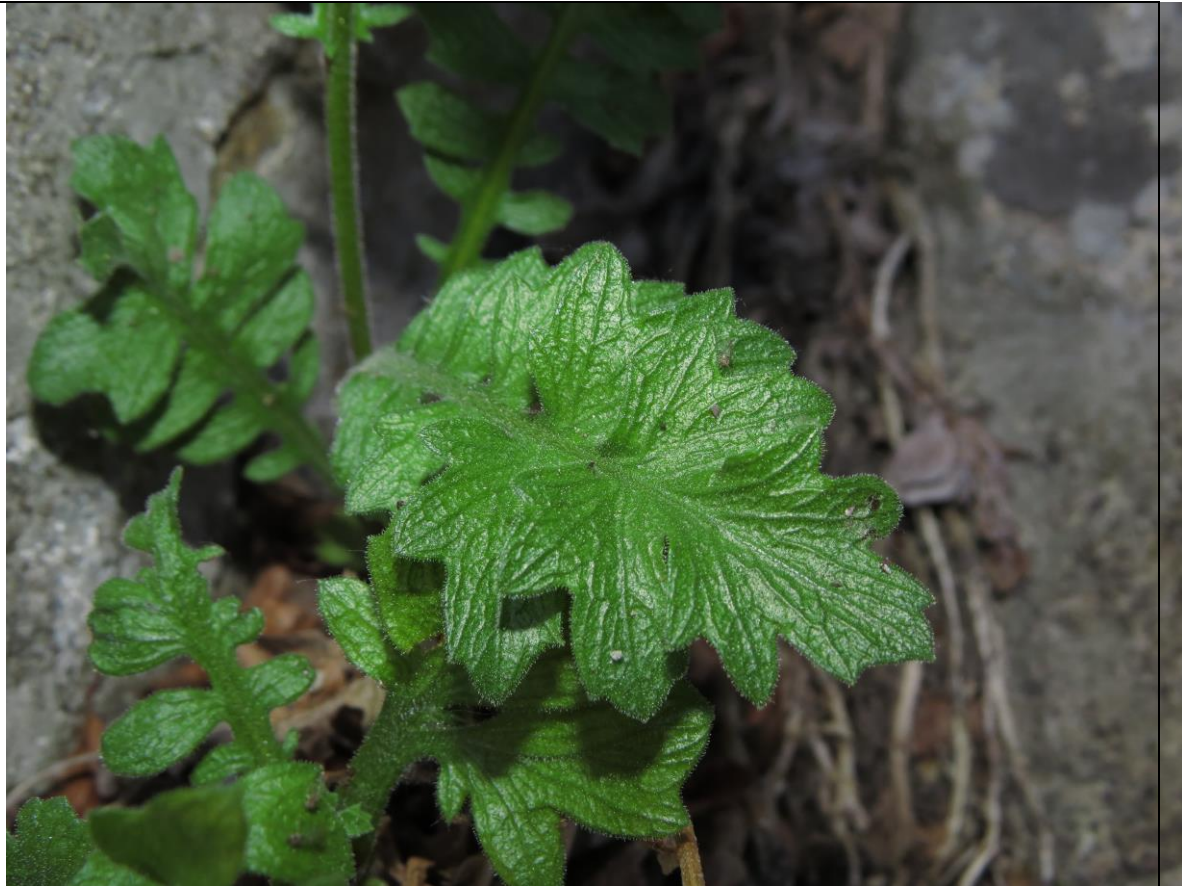
Figura 4. Leucheria cantillanensis. Detalle de las hojas. 26-12-2019.