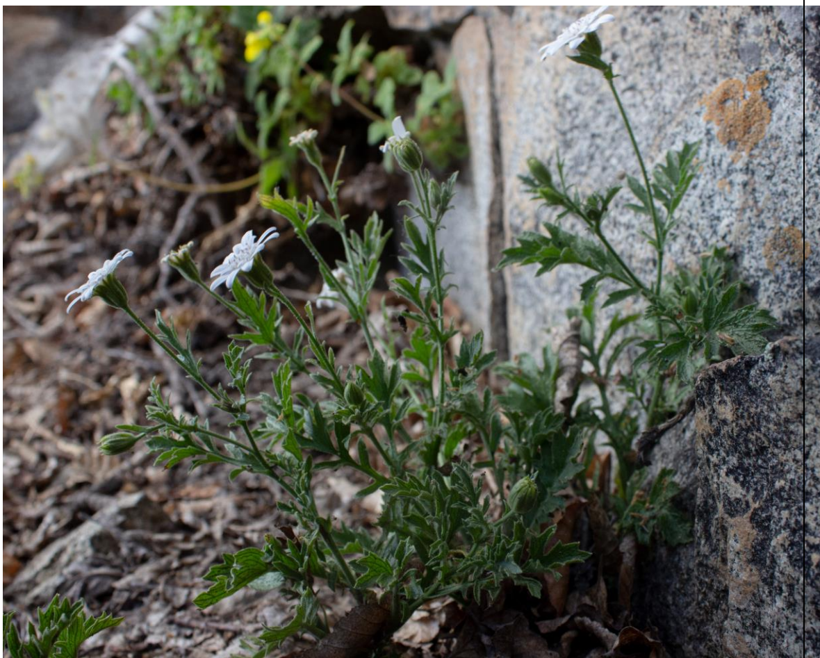
Figura 1. Leucheria cantillanensis. Hábito de la planta. 29-12-2020.