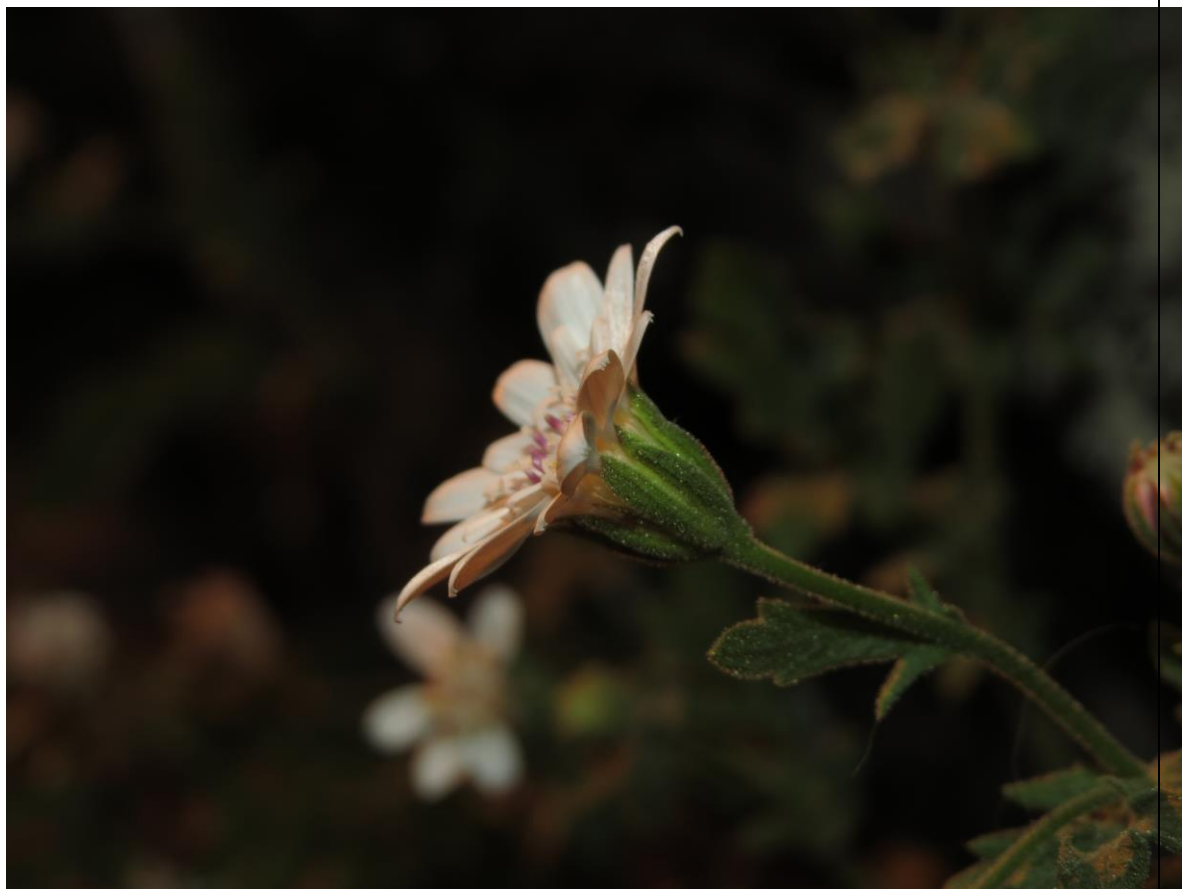
Figura 3. Leucheria cantillanensis. Detalle del capítulo. 26-12-2019.