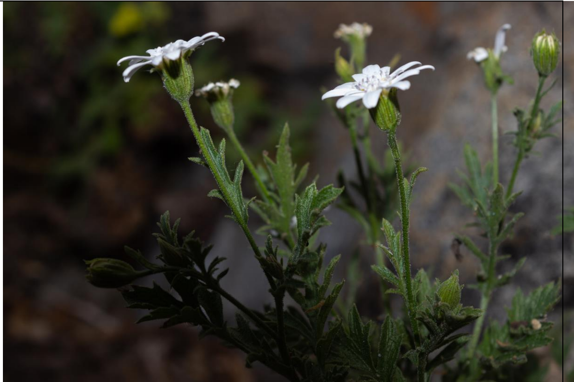
Figura 2. Leucheria cantillanensis. Detalle de la planta. 29-12-2020.