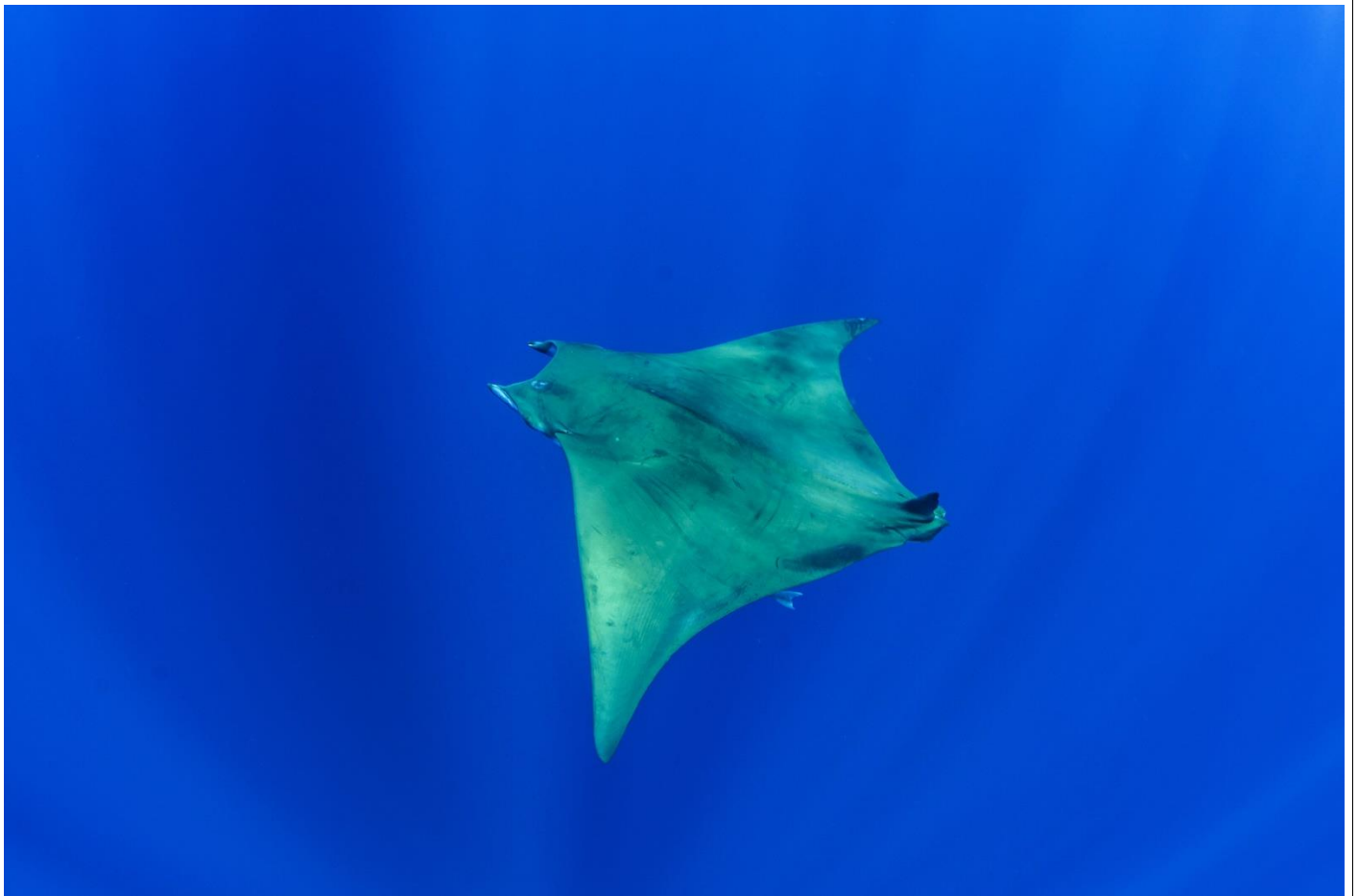
Ejemplar de Mobula tarapacana observado en Isla Santa Elena.