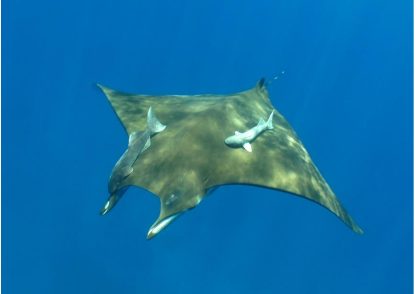
Ejemplar de Mobula tarapacana observado en Isla Santa Elena.