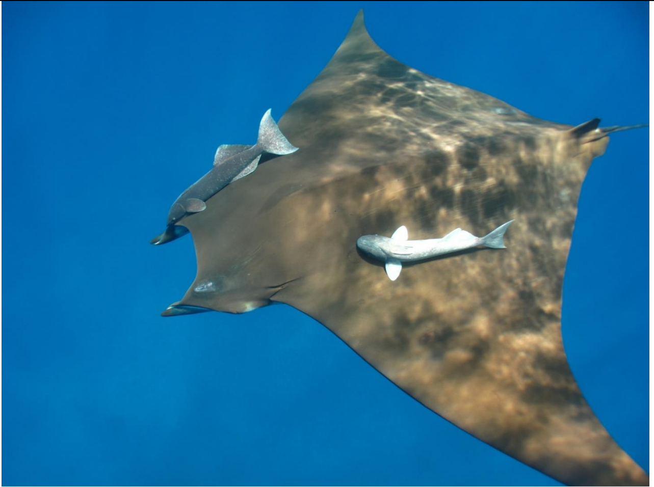
Ejemplar de Mobula tarapacana observado en Isla Santa Elena.