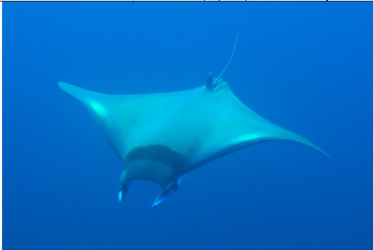
Ejemplar de Mobula thurstoni observado en Cebu, Filipinas.

Manta diablo (Español), Bentfin Devilray