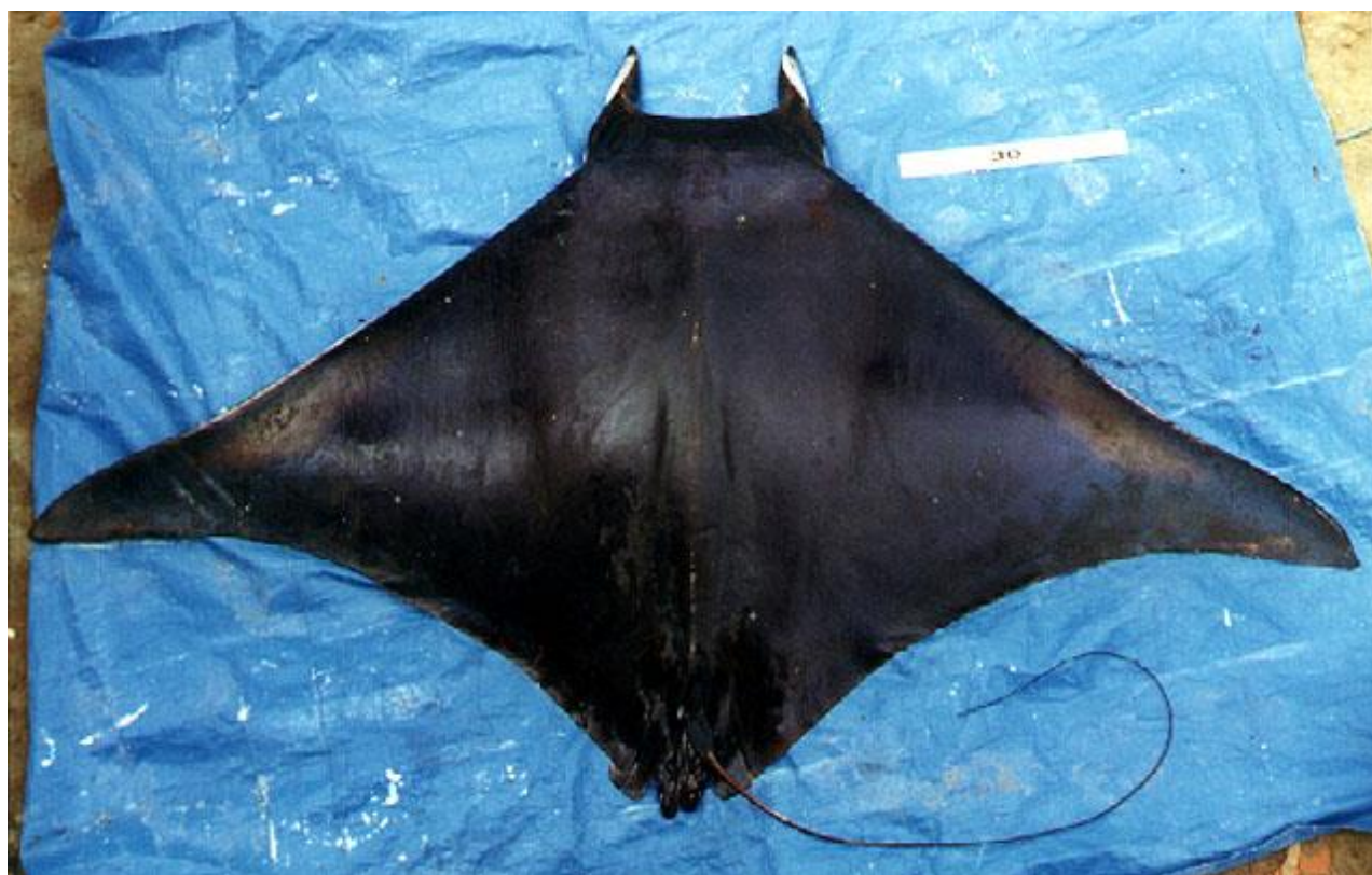
Ejemplar de Mobula thurstoni capturado en Sao Paulo, Brasil.