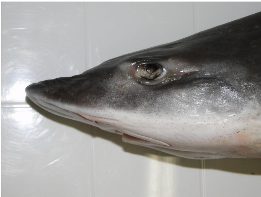
Detalle lateral de la cabeza de Mustelus mento , Valdivia, Chile.