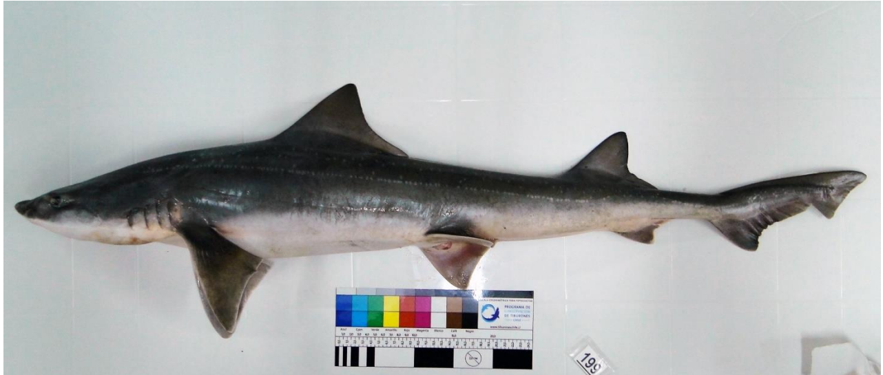
Vista lateral de juvenil de Mustelus mento , Valdivia, Chile.