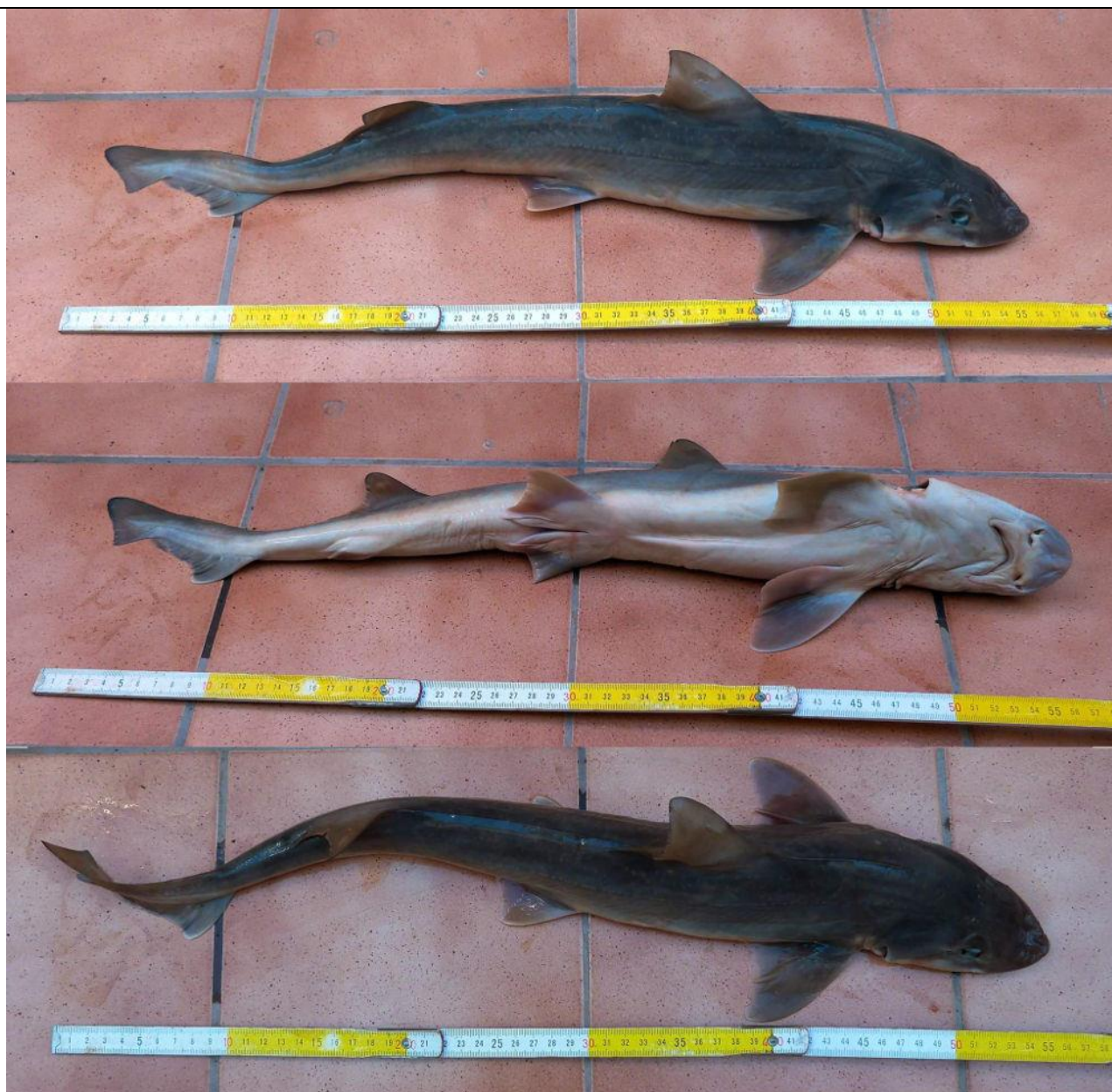
Vista lateral de juvenil de Mustelus mento , Caldera, Chile.