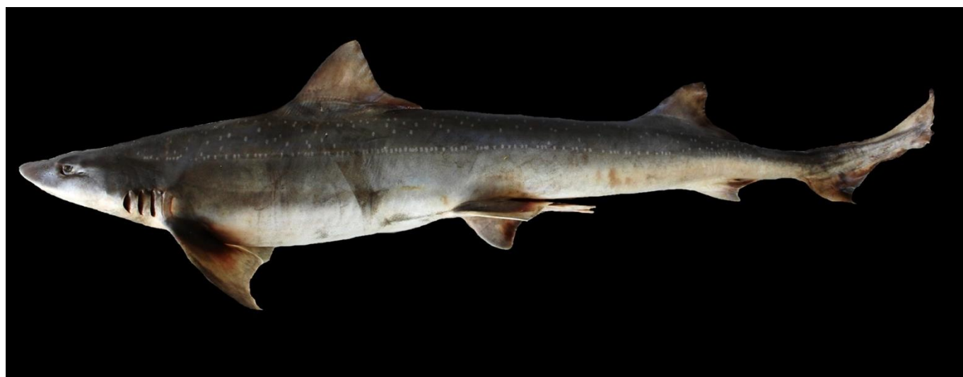
Vista lateral de adulto de Mustelus mento , Valparaíso, Chile.