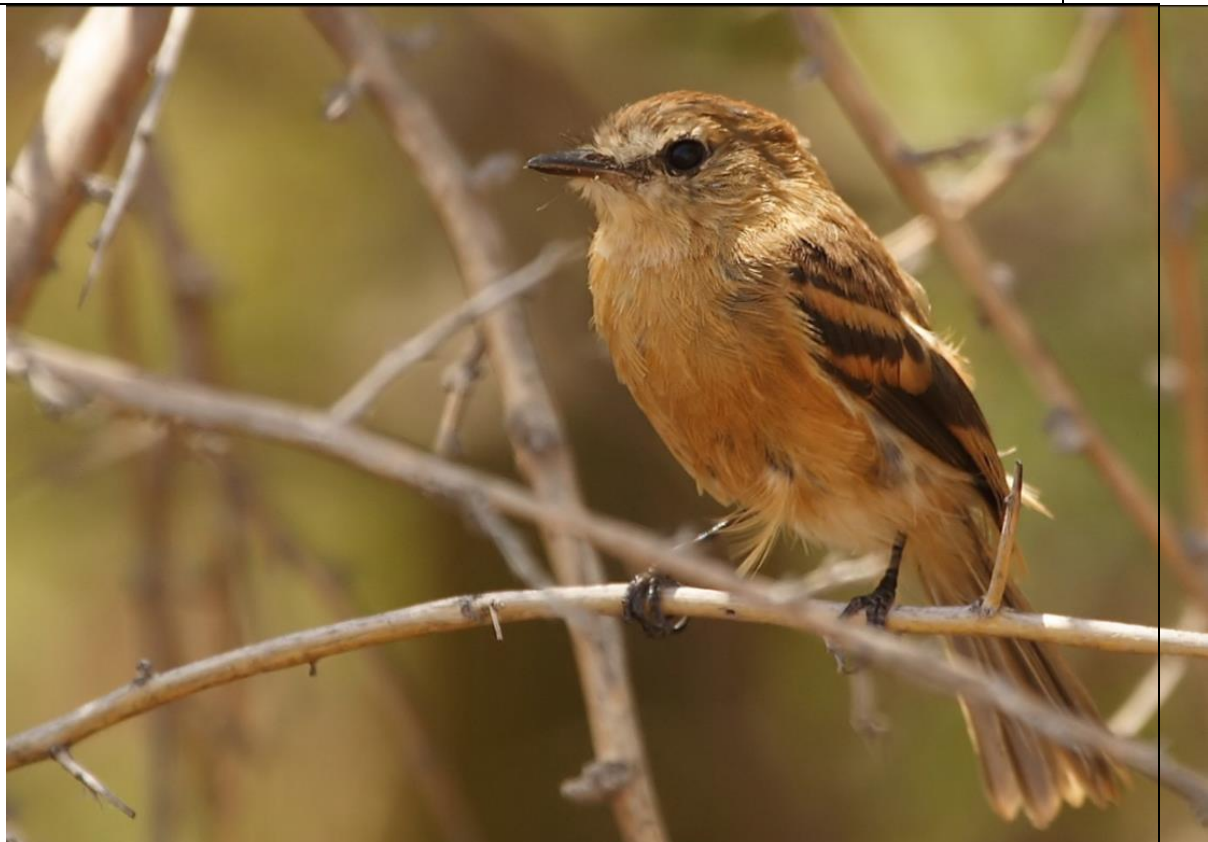
Cazamoscas de pico chato.