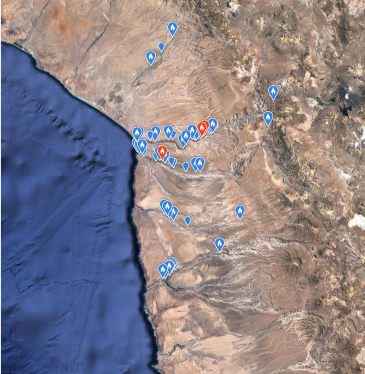
Registros de Myiophobus fasciatus en el norte de Chile (eBird, 2021)