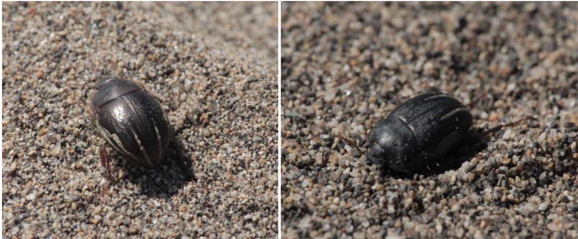
Fig. 1. Habitus de Praocis (Praocis) bicentenario Flores & Pizarro-Araya 2012 (Coleoptera: Tenebrionidae), en las dunas costeras de Huentelauquén (Región de Coquimbo, Chile).