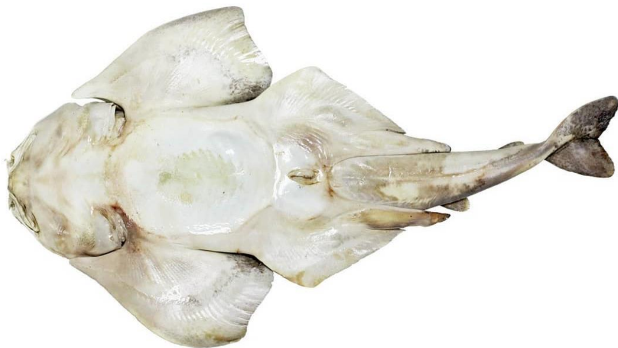
Vista ventral de ejemplar adulto de Squatina armata . Valparaíso, Chile.