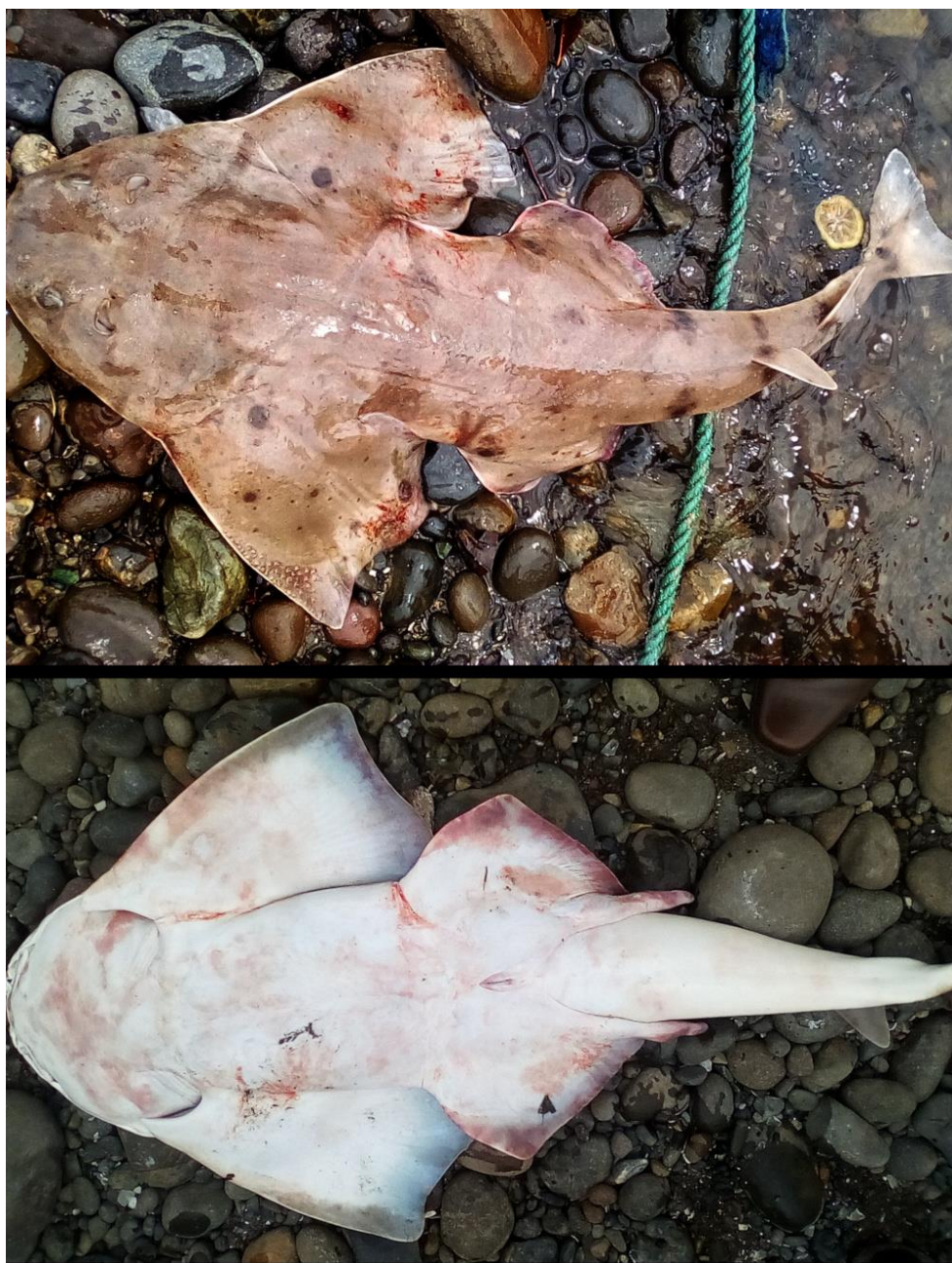
Vista dorsal y ventral de adulto de Squatina armata . Tumaco, Colombia.

Angelote chileno (Español), Chilean Angelshark