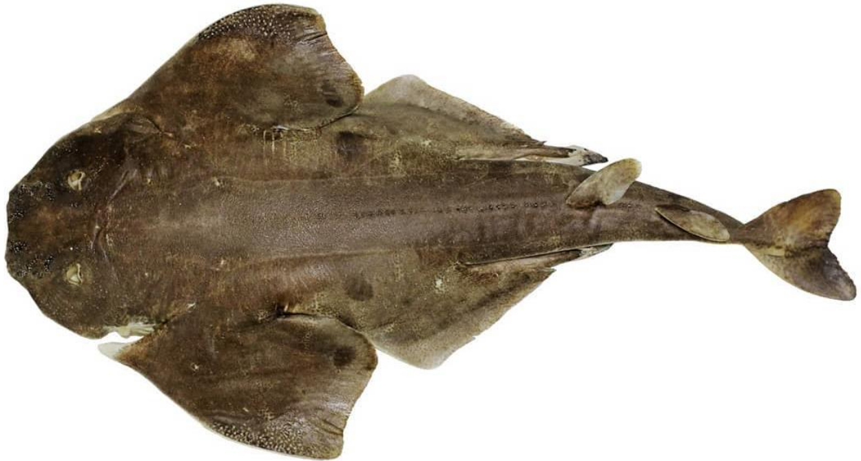
Vista dorsal de ejemplar adulto de Squatina armata . Valparaíso, Chile.