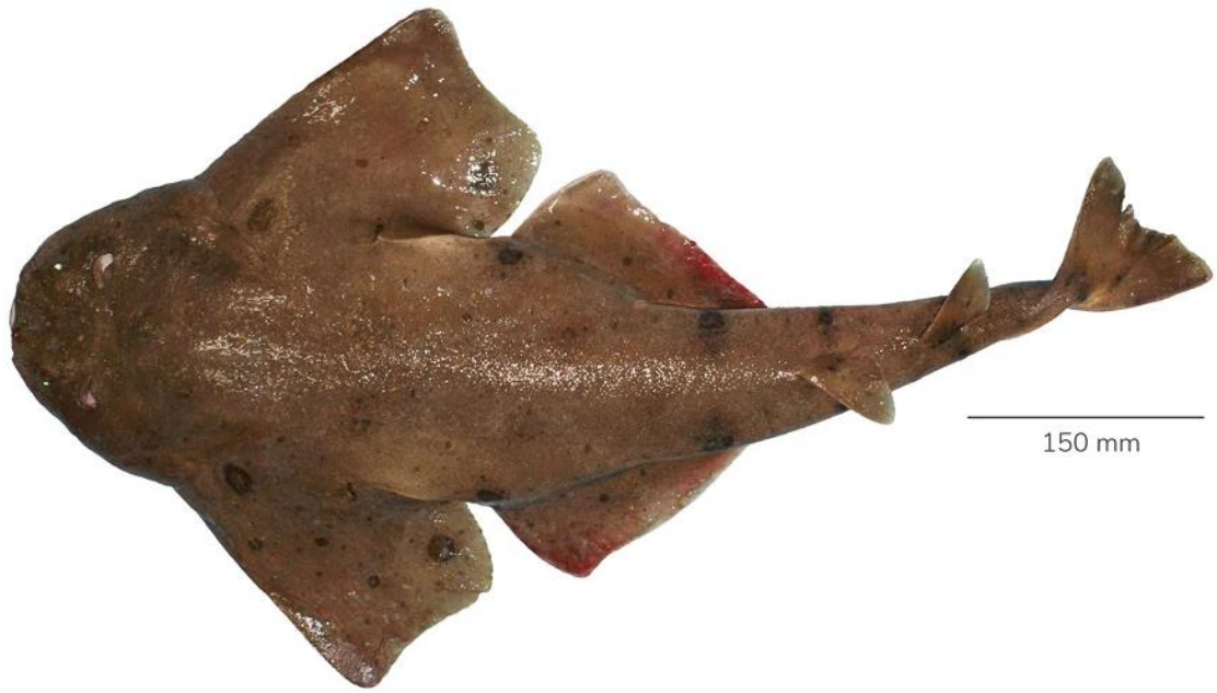
Vista dorsal de Squatina armata . Perú.