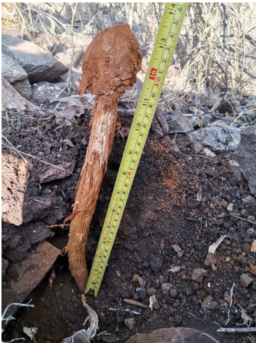
Fotografía: Battarrea phalloides , punto 6 (Quilicura, mayo 2021), autor: Felipe González